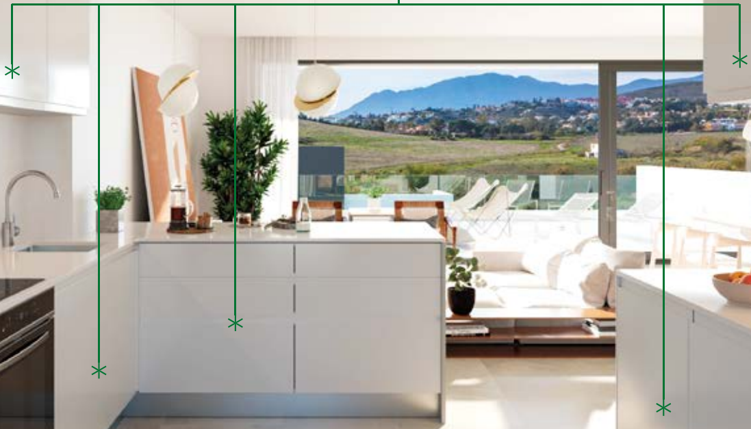
Phase 1 kitchen options. Opciones de cocina fase 1.