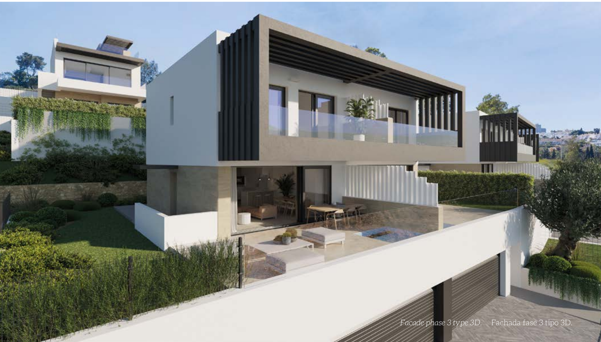
Facade phase 3 type 3D. Fachada fase 3 tipo 3D.