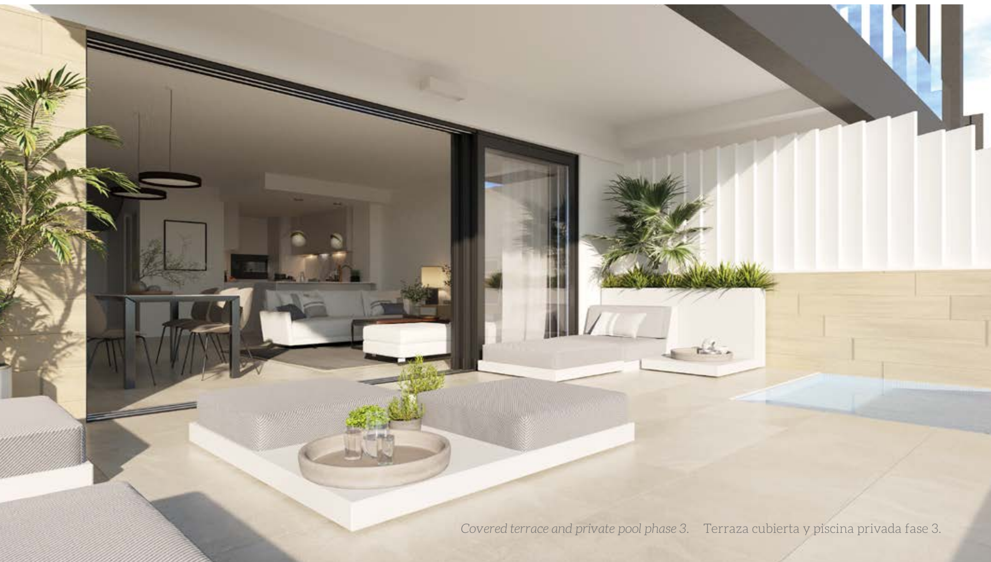
Covered terrace and private pool phase 3. Terraza cubierta y piscina privada fase 3.