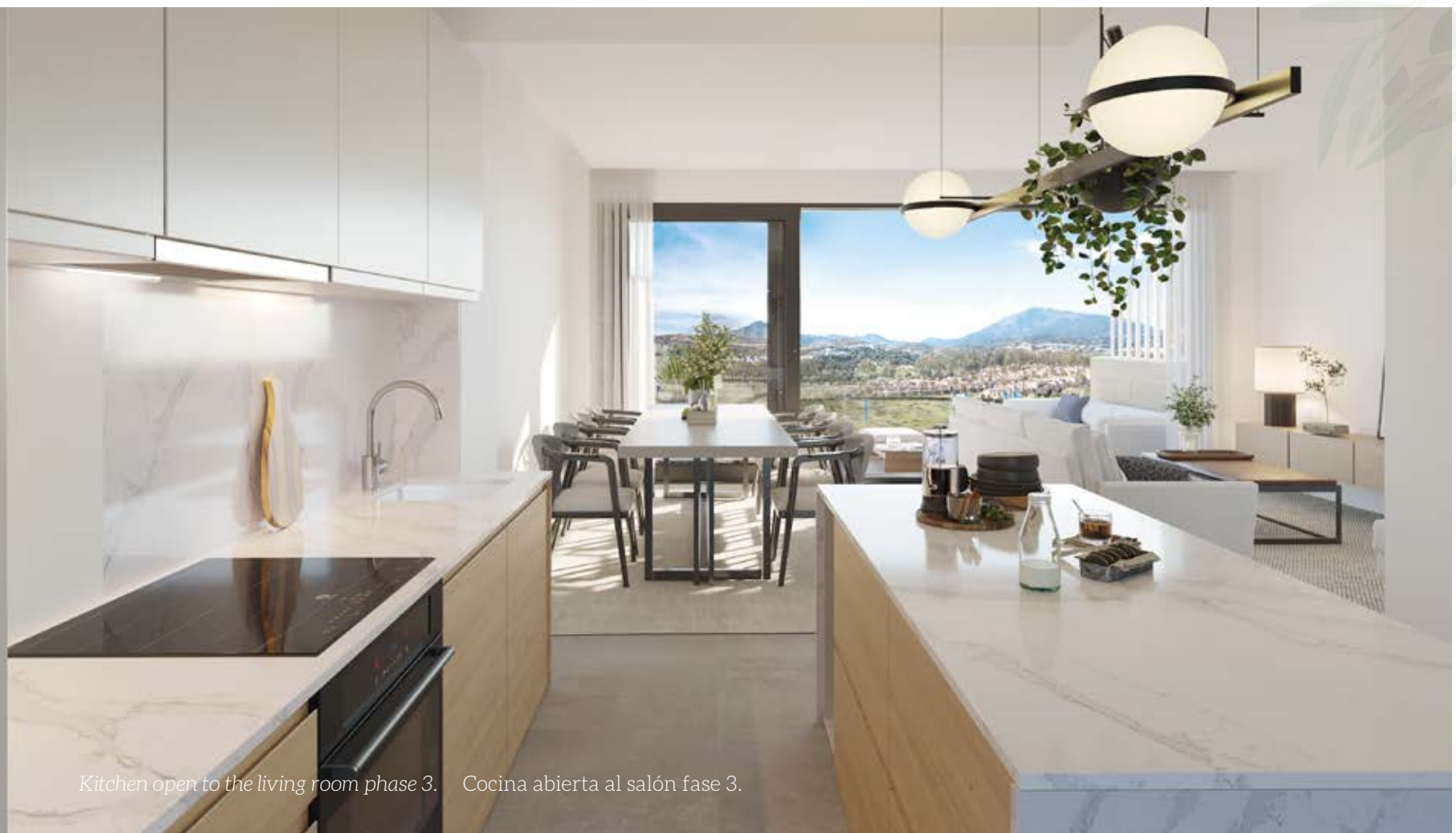
Kitchen open to the living room phase 3. Cocina abierta al salón fase 3.