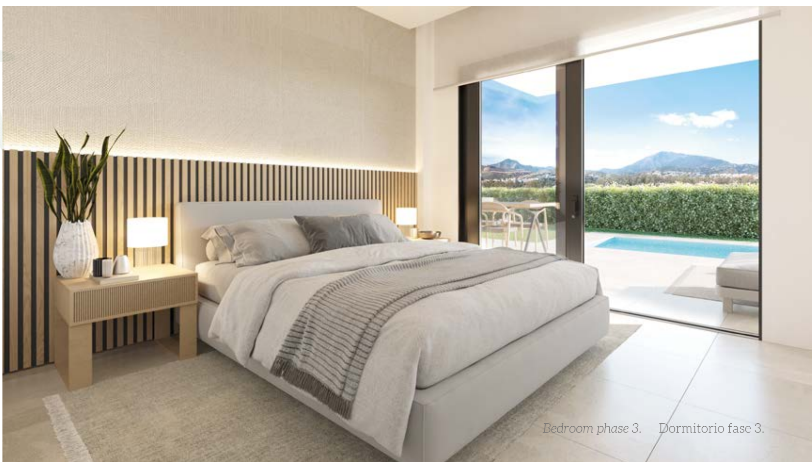
Bedroom phase 3. Dormitorio fase 3.