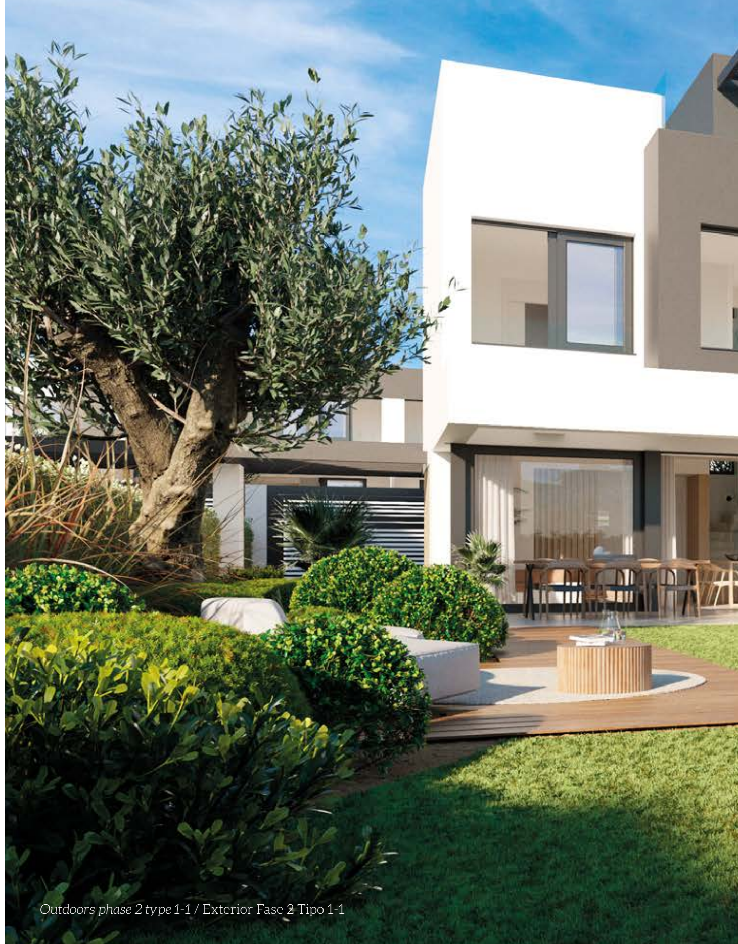
Outdoors phase 2 type 1-1 / Exterior Fase 2 Tipo 1-1