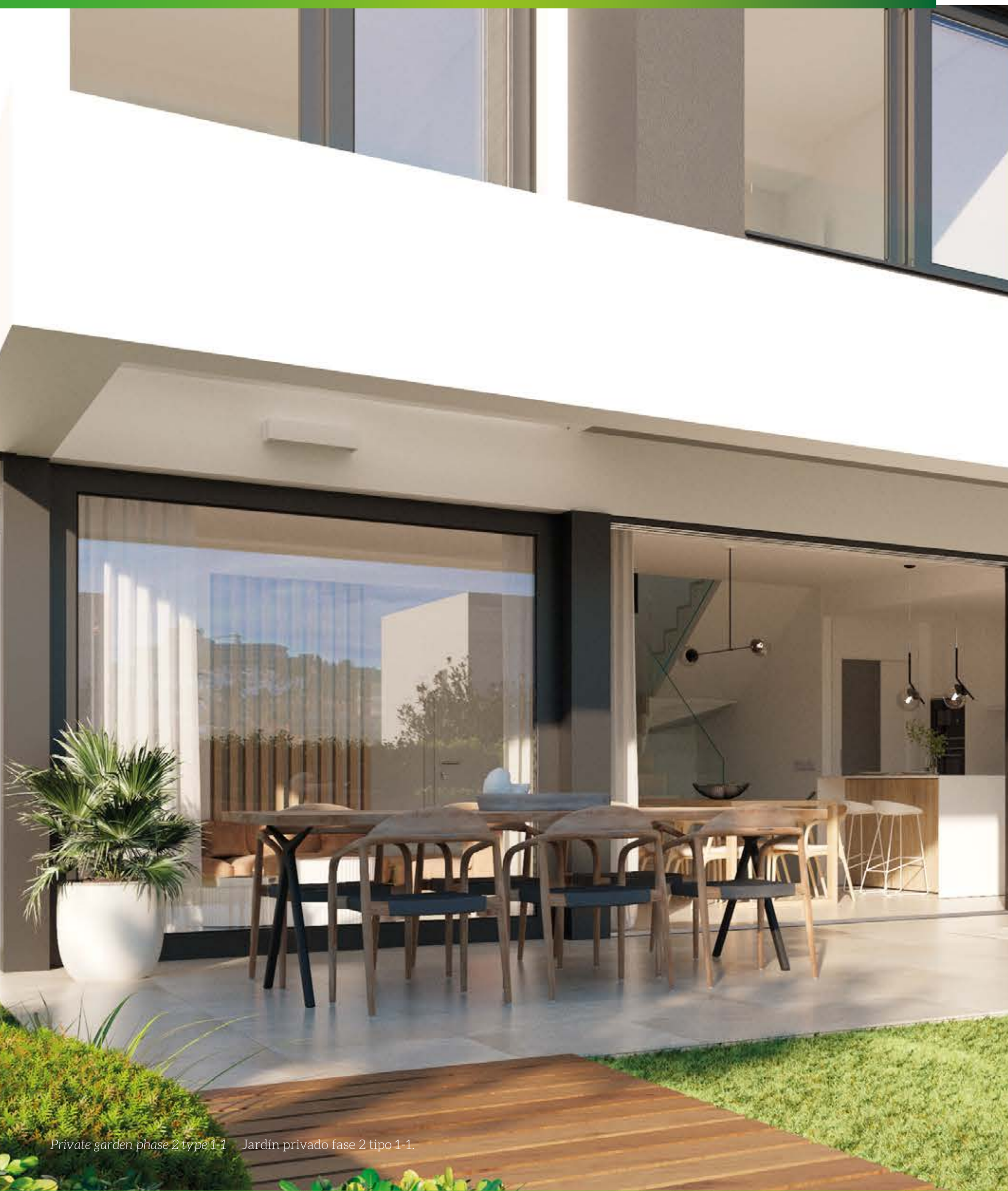
Private garden phase 2 type 1-1 Jardín privado fase 2 tipo 1-1.