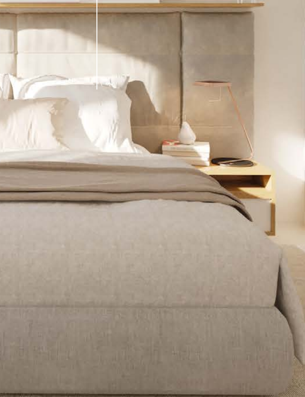
Main bedroom phase 2 type 1-1 / Dormitorio principal fase 2 tipo 1-1