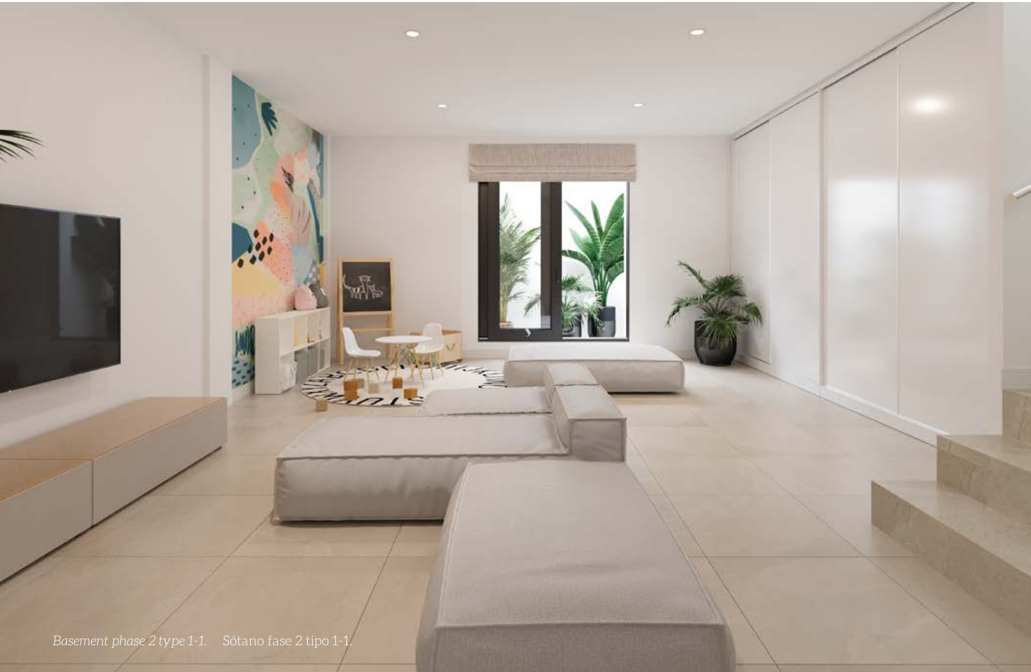
Basement phase 2 type 1-1. Sótano fase 2 tipo 1-1.