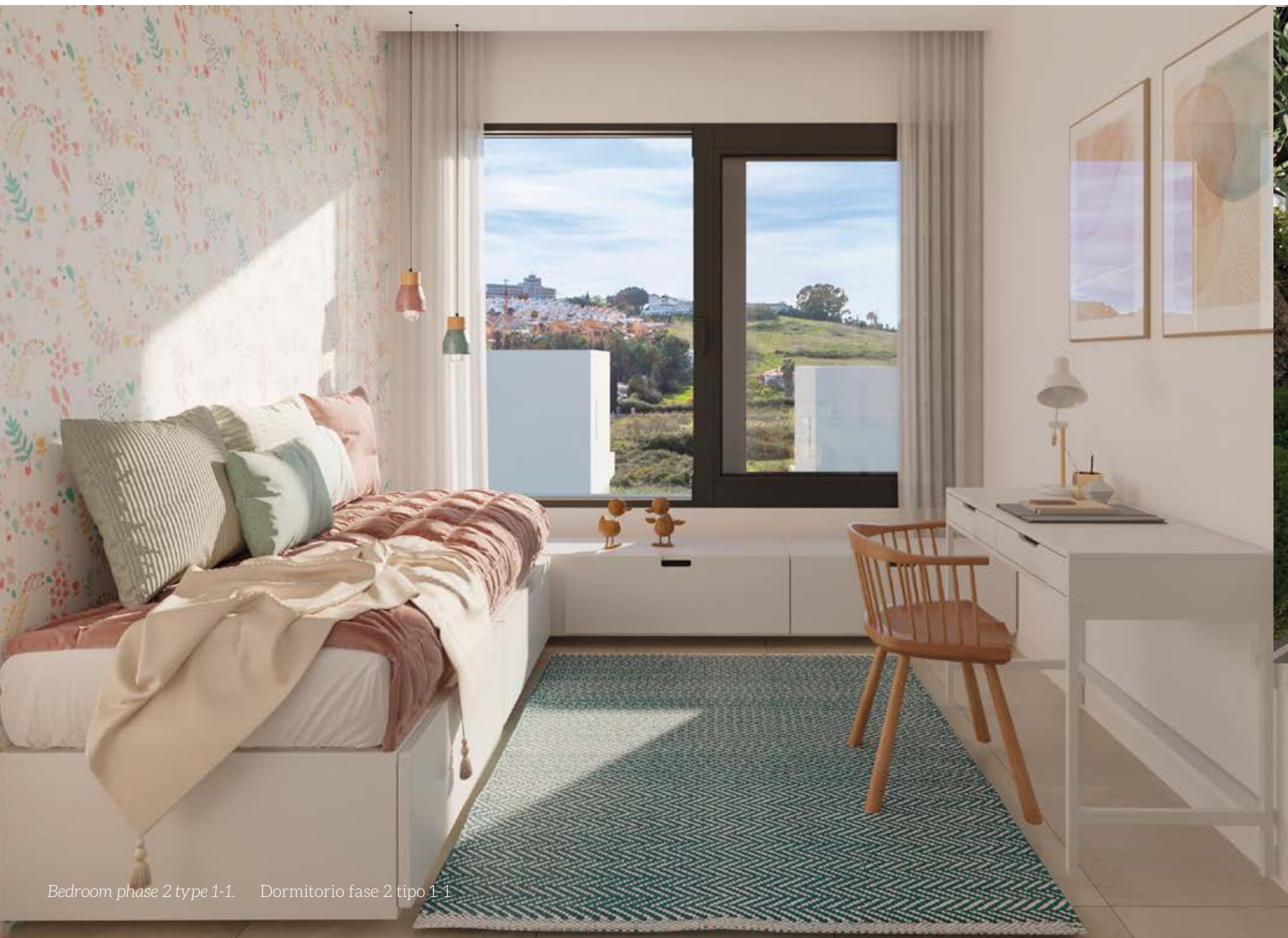
Bedroom phase 2 type 1-1. Dormitorio fase 2 tipo 1-1