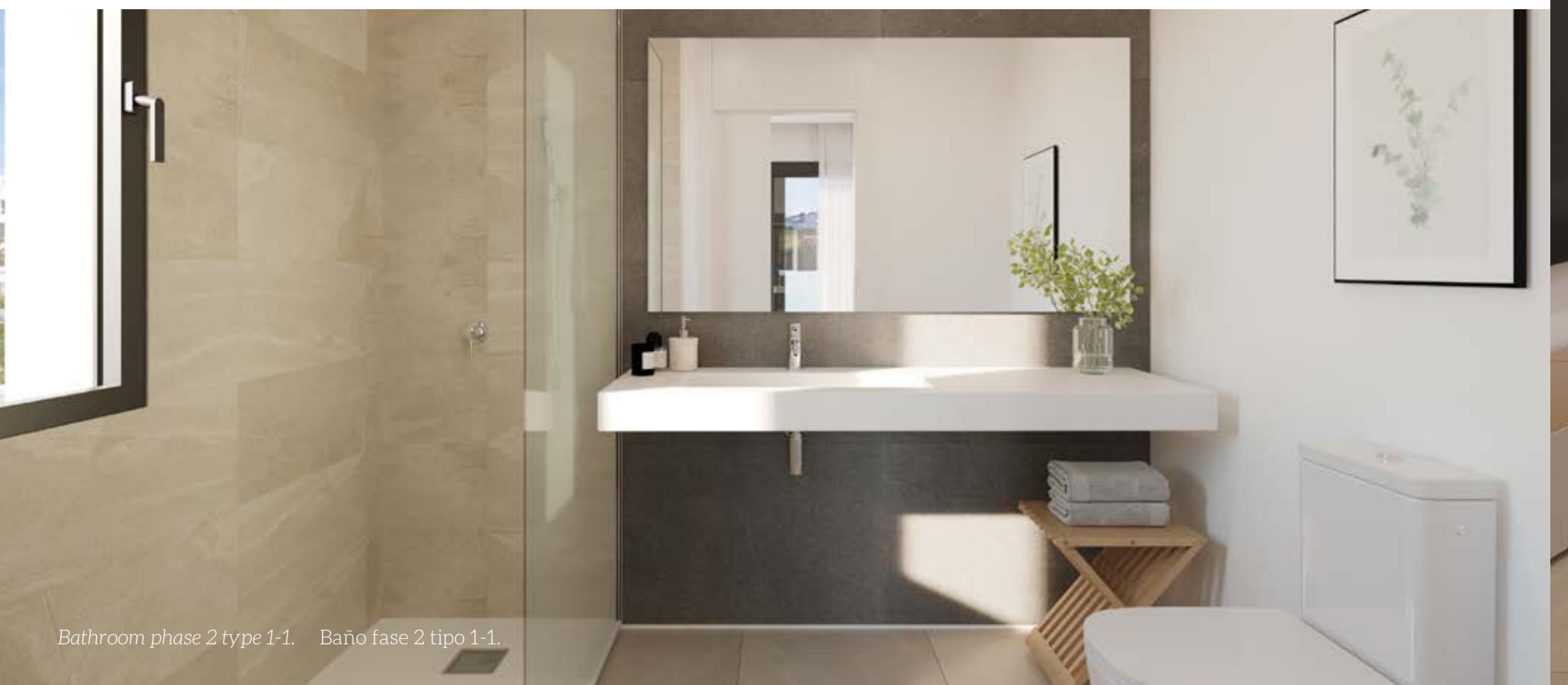
Bathroom phase 2 type 1-1. Baño fase 2 tipo 1-1.