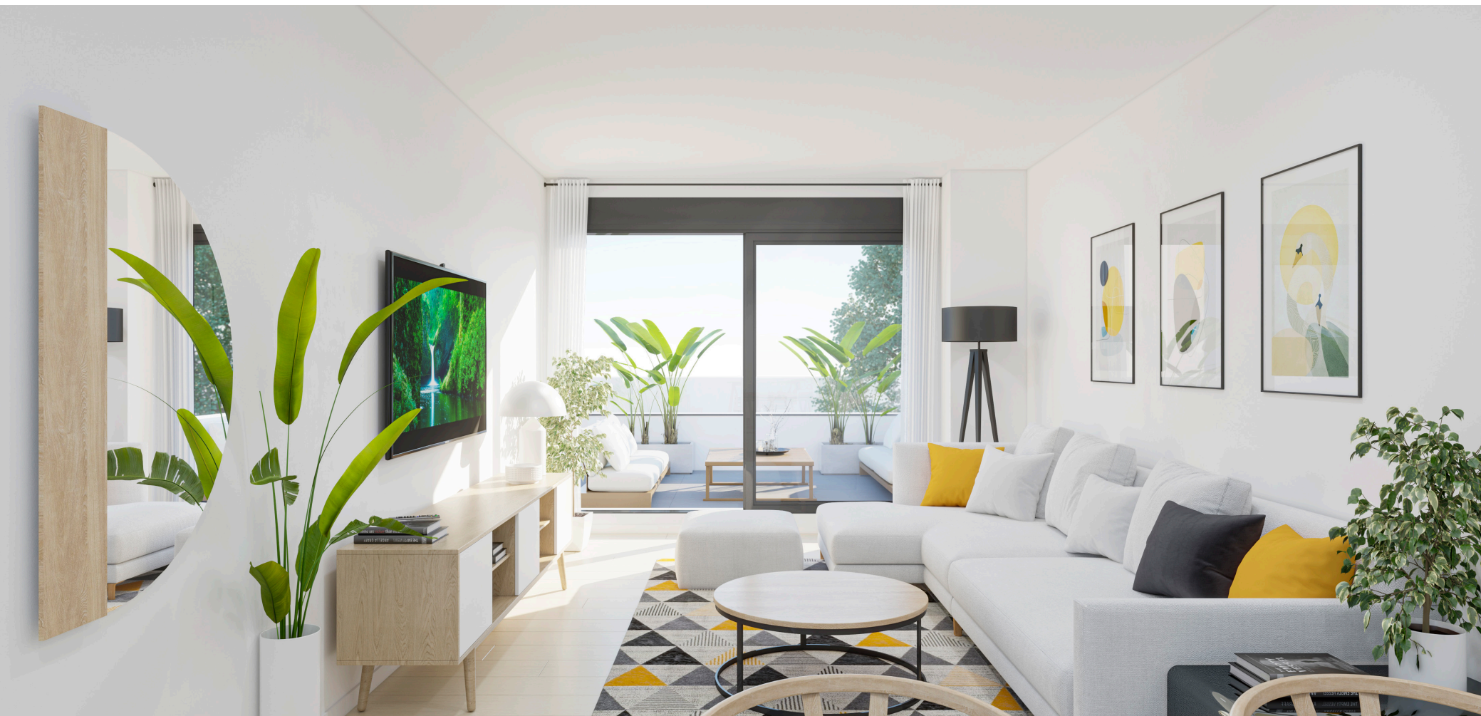
Interior de la vivienda. Acabados