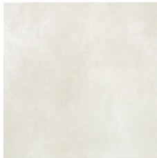
ARGENTA Porcelánico 60x60 cm.