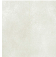
ARGENTA Porcelánico antideslizante 60x60 cm.