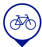
Cuarto de bicicletas y carritos de bebés