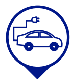
Preinstalación recarga de vehículos eléctricos