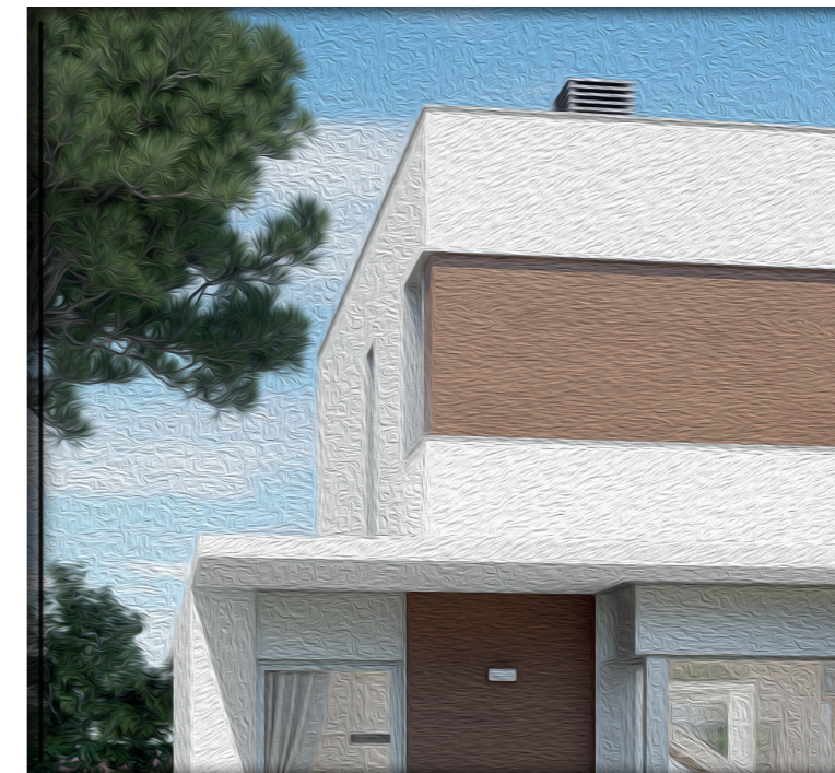
EL JUNCAL CUARTE DE HUERVA