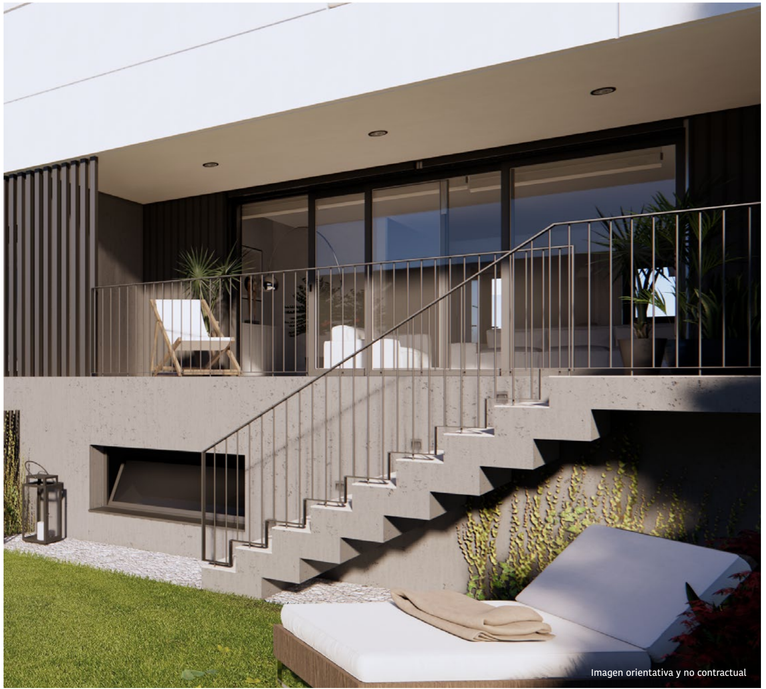
Imagen orientativa y no contractual