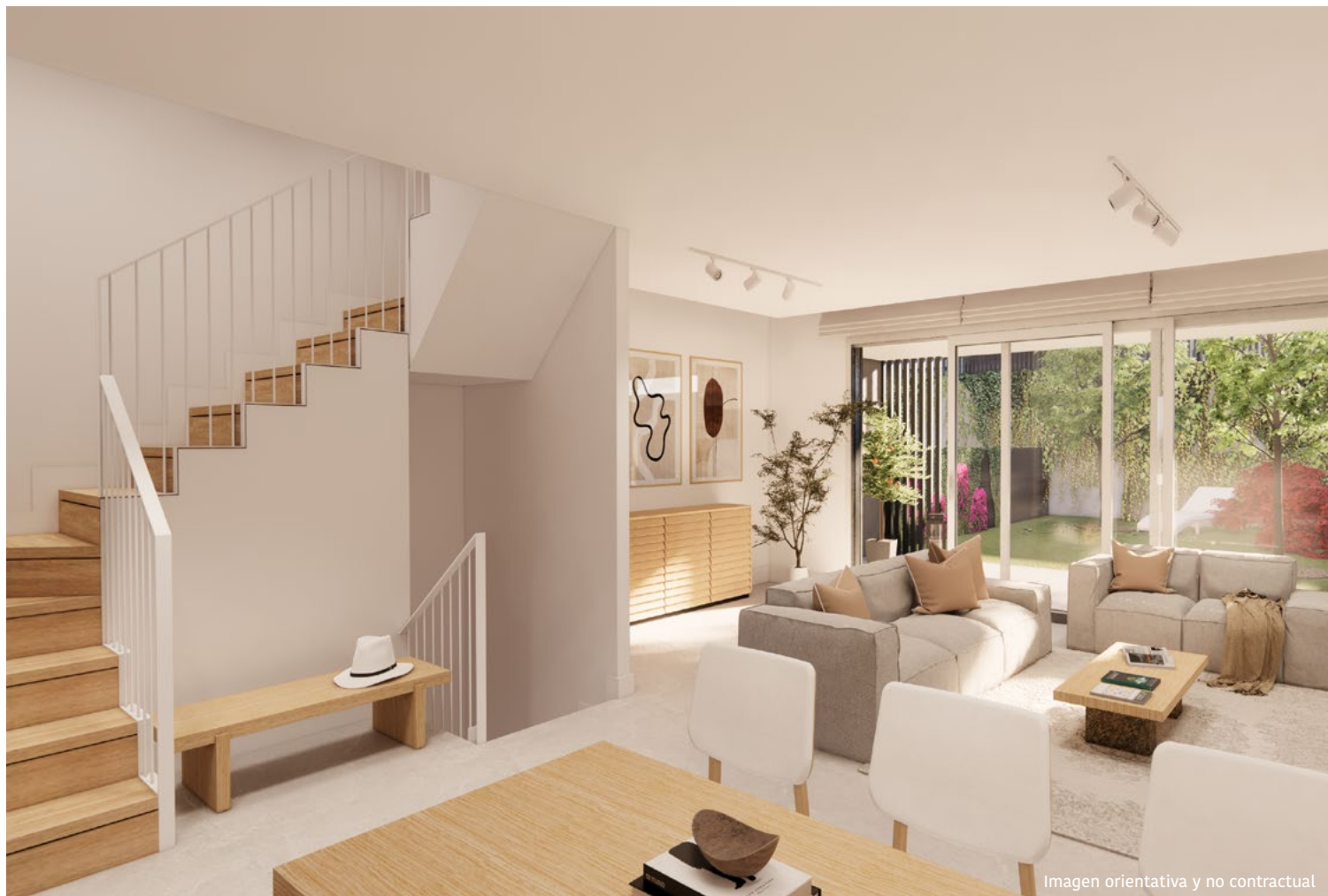
Imagen orientativa y no contractual

Los peldaños de las escaleras interiores entre la planta baja y la planta alta, se revestirán en madera de roble, y en bajada a planta sótano con el mismo pavimento general de gres porcelánico.