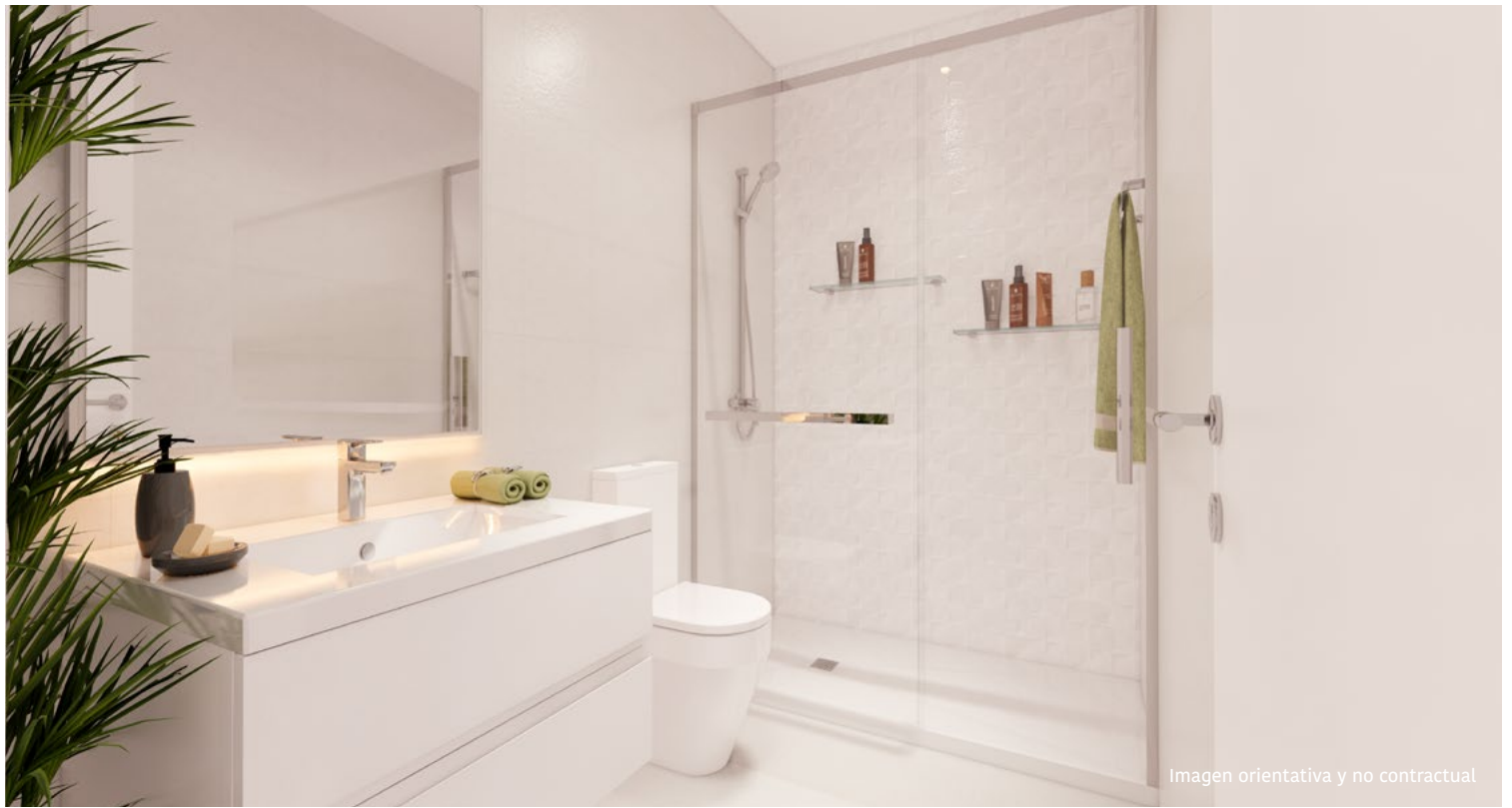
Imagen orientativa y no contractual