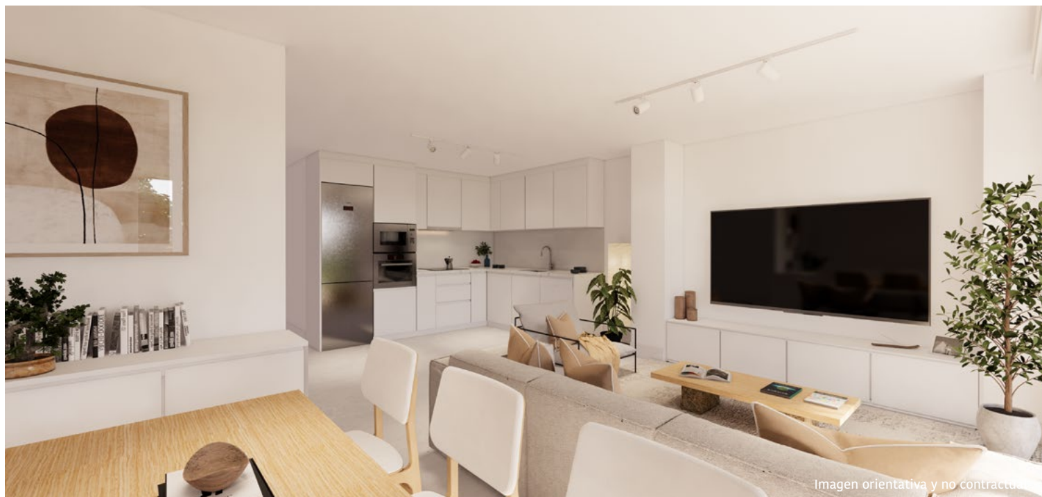
Imagen orientativa y no contractual

Asimismo se instalará video-portero con terminal en el vestíbulo de la vivienda.