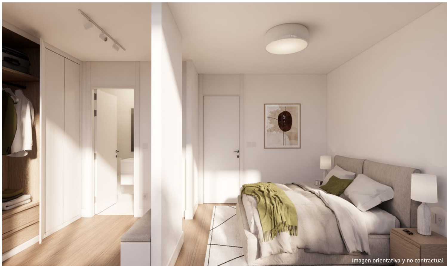
Imagen orientativa y no contractual

Para una mayor comodidad, el armario del hall se entregará con barra de colgar y balda maletero.