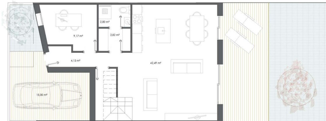
Planta Baja. Zona de Día