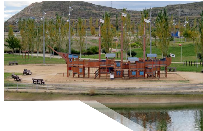
Parque Libro de la Selva