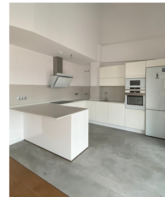
Promoción Edificio Plaza