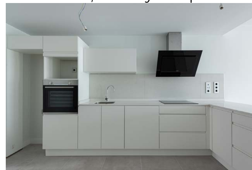
Promoción Woermann Playa

Los electrodomésticos que se incluirán en la cocina son: placa de inducción, horno y campana extractora.