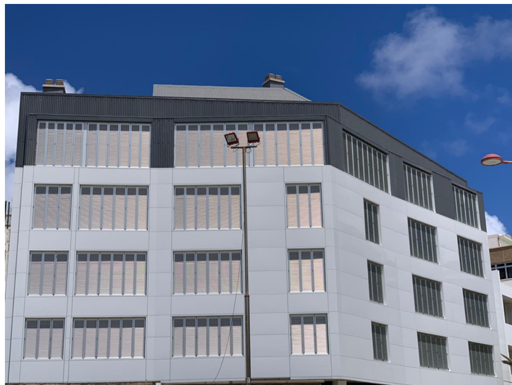
Edificio Plaza del Pilar Plaza del Pilar 4, C/Lepanto35 y C/Castillejos 44