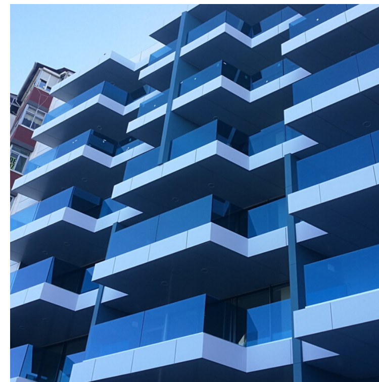
Edificio Dársena C/León y Castillo 395 C/Presidente Alvear 34