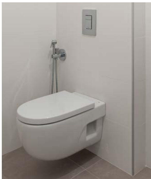
Promoción Woermann Playa

Estarán equipados con grifería monomando, de ROCA de primera calidad, en acabado cromado.