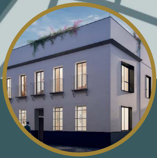
MONEDEROS 19 01