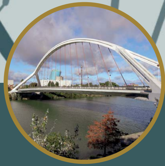
PASEO FLUVIAL 06