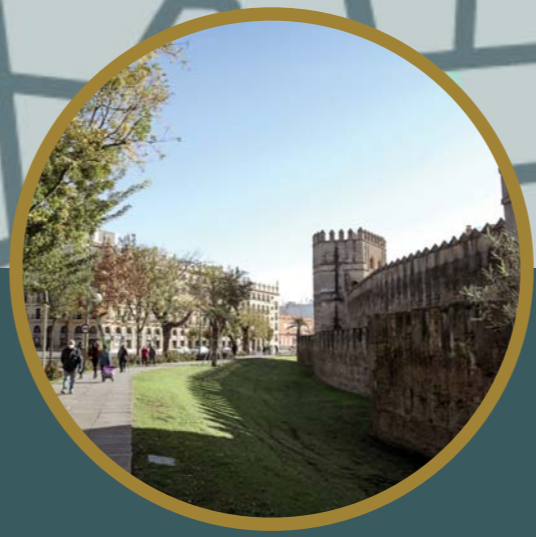
MURALLA ALMORÁVIDE 04