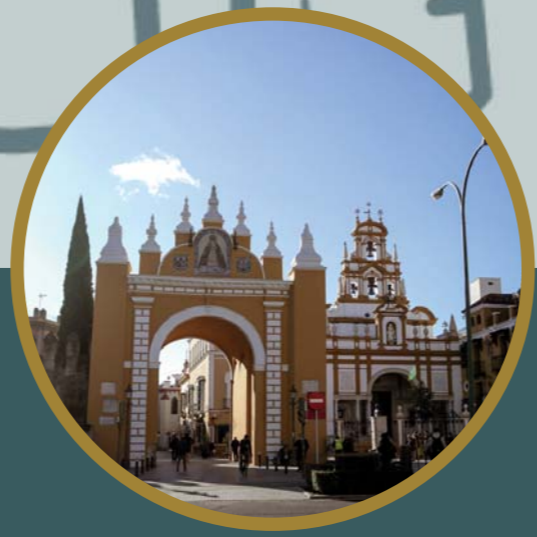
ARCO - BASÍLICA DE LA MACARENA 03