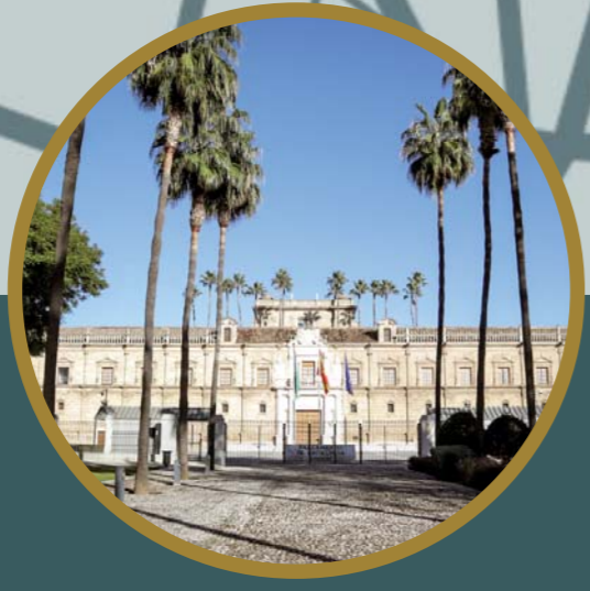
PARLAMENTO DE ANDALUCÍA 02