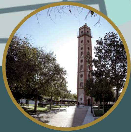
TORRE DE LOS PERDIGONES 05