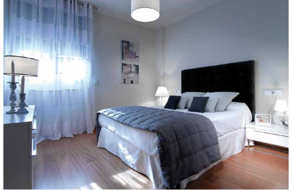
Imágenes correspondientes a vivienda piloto de Edificio Puerta del Príncipe.