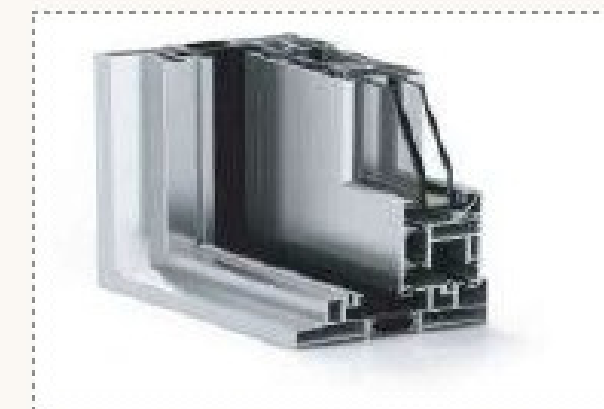
Carpintería gris antracita