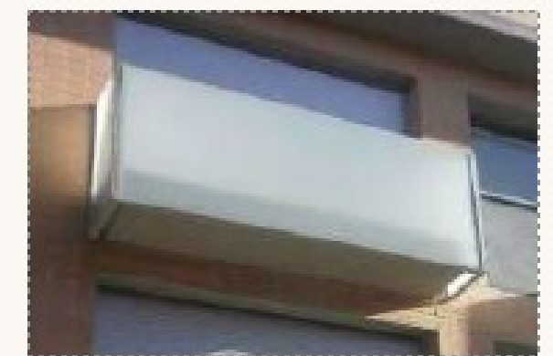
Balcones vidrio translúcido