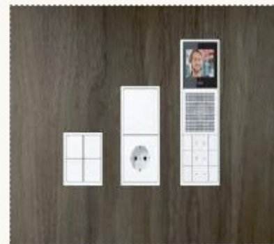
Mecanismos diseño blanco