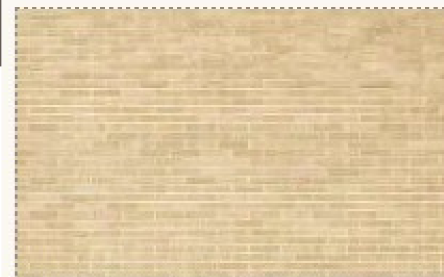
Ladrillo cara vista