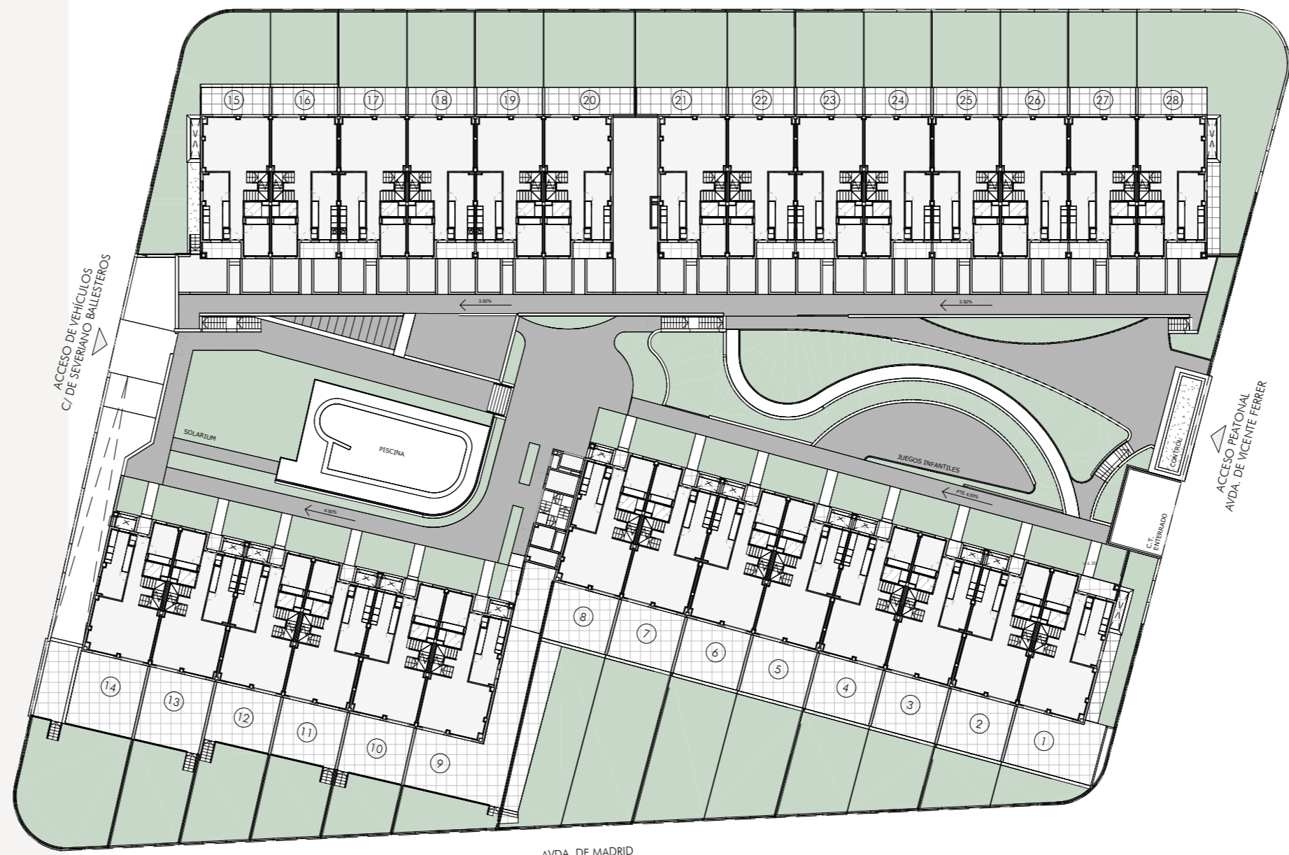
PLANTA BAJA GENERAL