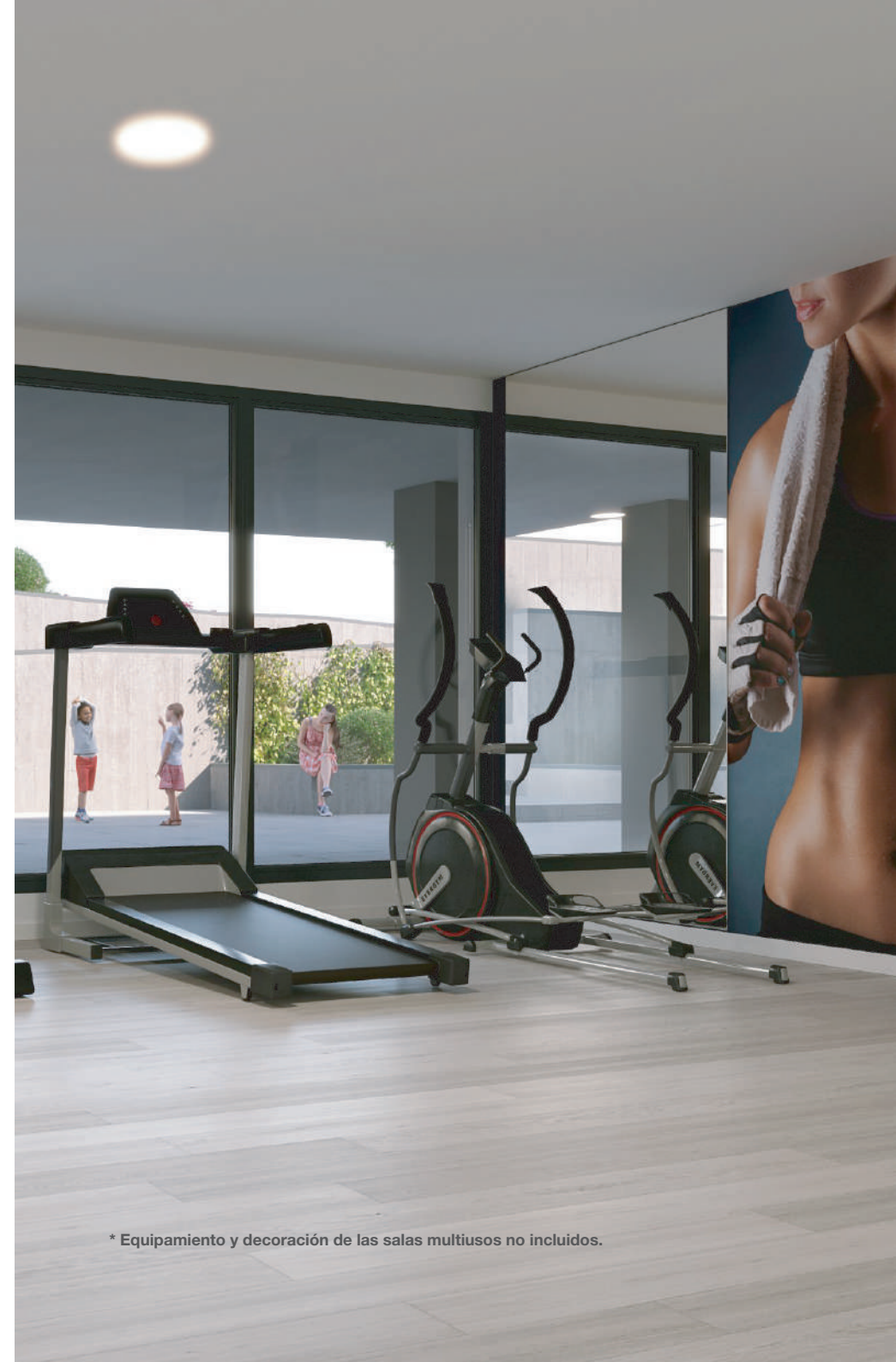
* Equipamiento y decoración de las salas multiusos no incluidos.

Nota Importante: La presente memoria de calidades constructivas es meramente orientativa, reservándose CONSTRUCTORA LOS ÁLAMOS, la facultad de introducir aquellas modificaciones que vengan motivadas por razones técnicas o jurídicas, que sean indicadas por el arquitecto director de la obra por ser necesarios o convenientes para la correcta finalización del edificio o que sean ordenadas por los organismos públicos competentes. En caso de que tales cambios afecten a materiales incluidos en la presente memoria, los materiales afectados serán sustituidos por otros de igual o superior calidad.