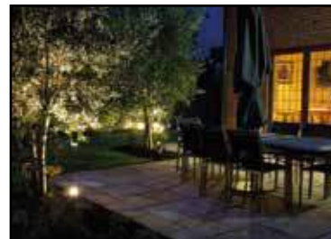
Instalación eléctrica _____ Instalación eléctrica según el Reglamento electrotécnico de baja tensión (REBT) con mecanismos de primera calidad.