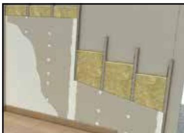
Tabiquería _____ Tabiquería seca tipo pladur.