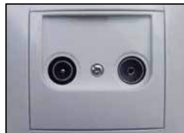
Instalación de telecomunicaciones _____ Instalación conforme a las exigencias del Reglamento de infraestructuras comunes de telecomunicaciones (ICT). Tomas de TV, telefonía y datos en salón, dormitorio principal.