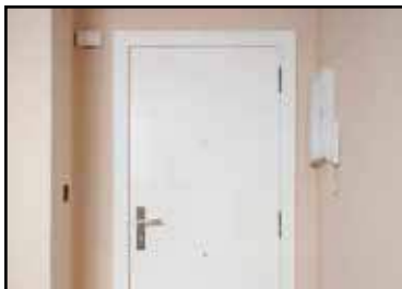
Carpintería interior _____ Puerta blindada de acceso a la vivienda. En el interior, puertas de paso lacadas en color blanco.