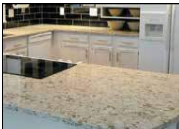
Equipamiento general _____ Las cocinas se amueblan con encimera de piedra natural, vitrocerámica, campana extractora, muebles altos y bajos según diseño. Grifo monomando.