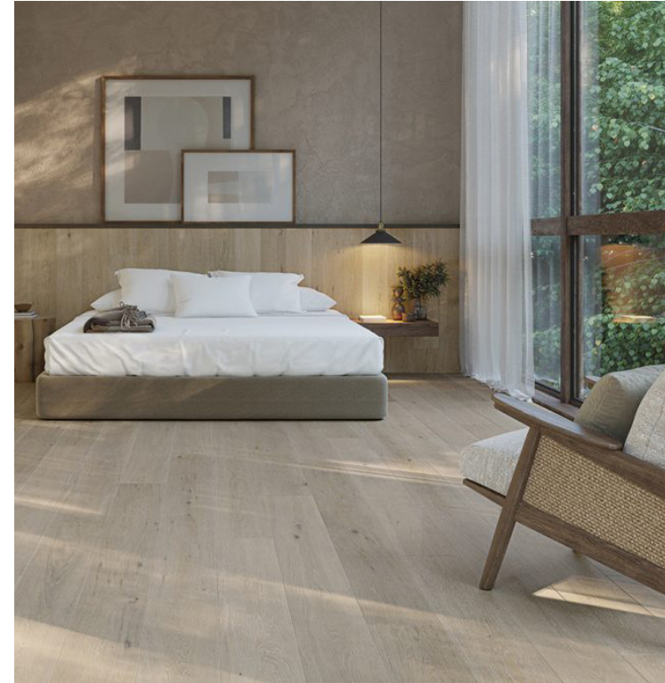
PORCELANOSA Devon Riviera 29,4x180