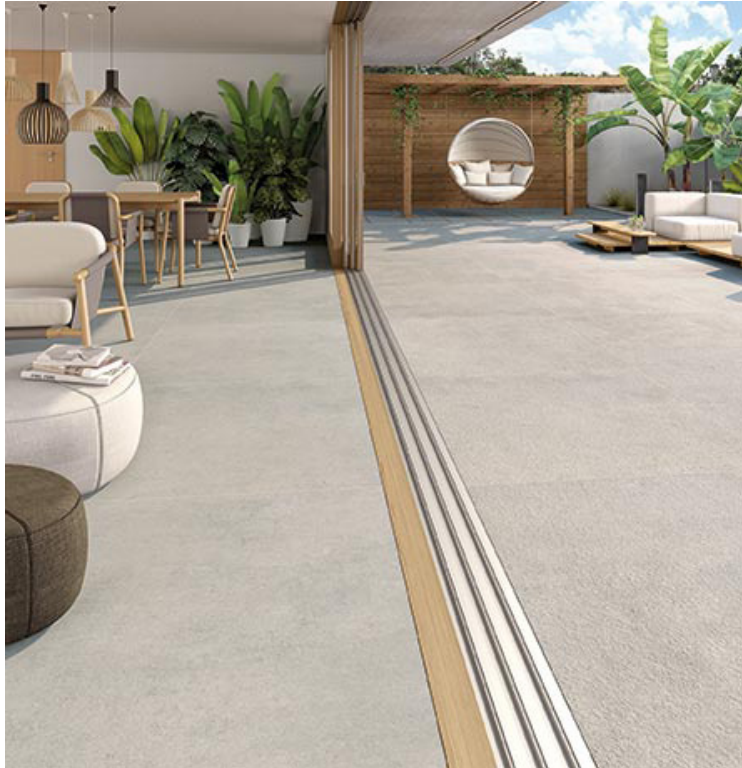
VIVES Nassau Grey 120x120