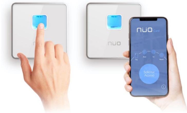
Sistema Nüo de control de accesos