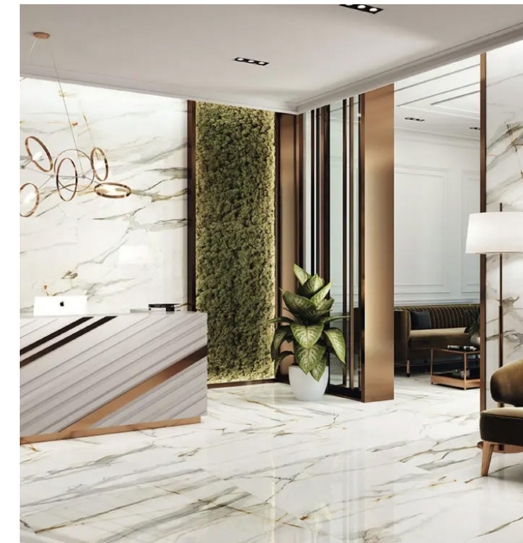
APE Calacatta Borghini 120x260