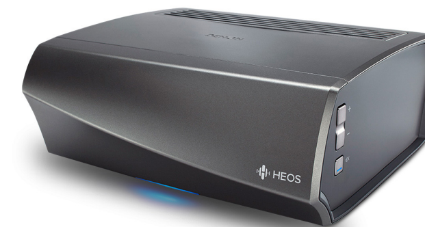
Denon® Amp HS2 permite escuchar música en todo la casa

Esta memoria de calidades está sujeta a modificaciones que vengan impuestas por razones técnicas, jurídicas o urbanísticas ordenadas por autoridad competente o que sean de obligado cumplimiento, así como por la indisponibilidad de existencias en el mercado, descatalogación o retirada del comercio, sin que ello pueda suponer una disminución de las calidades inicialmente previstas.