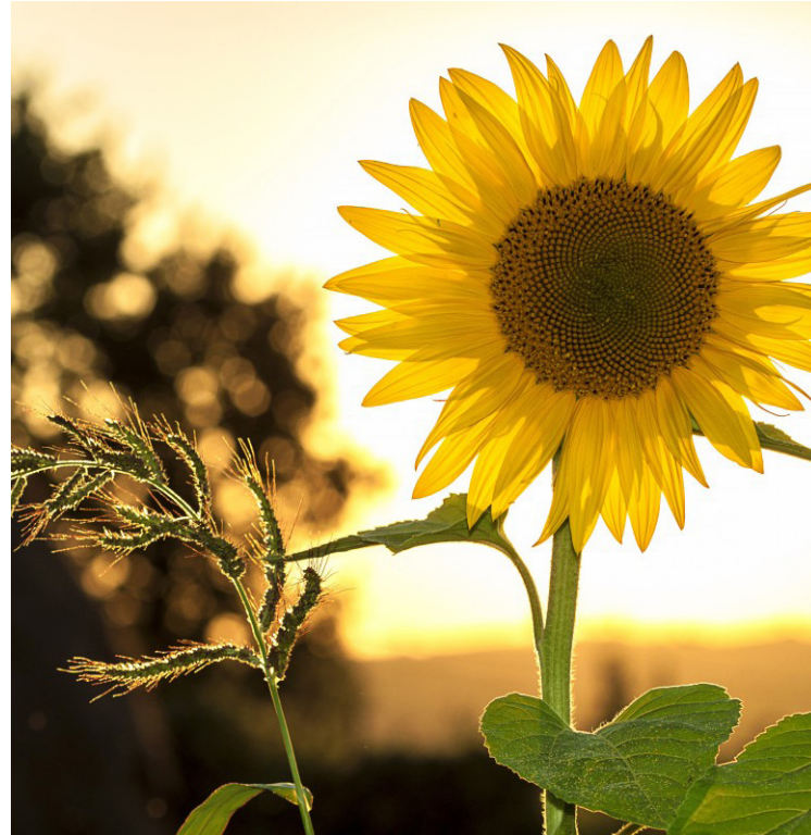
La villa cuenta con paneles solares

Todas las instalaciones de desagües se ejecutarán de manera independiente de la estructura disminuyendo la transmisión de ruidos a las viviendas. Todas las griferías utilizadas incorporan sistemas de ahorro de agua y energía para un uso más eficiente de los recursos lo que redundará en un menor consumo de los mismos.