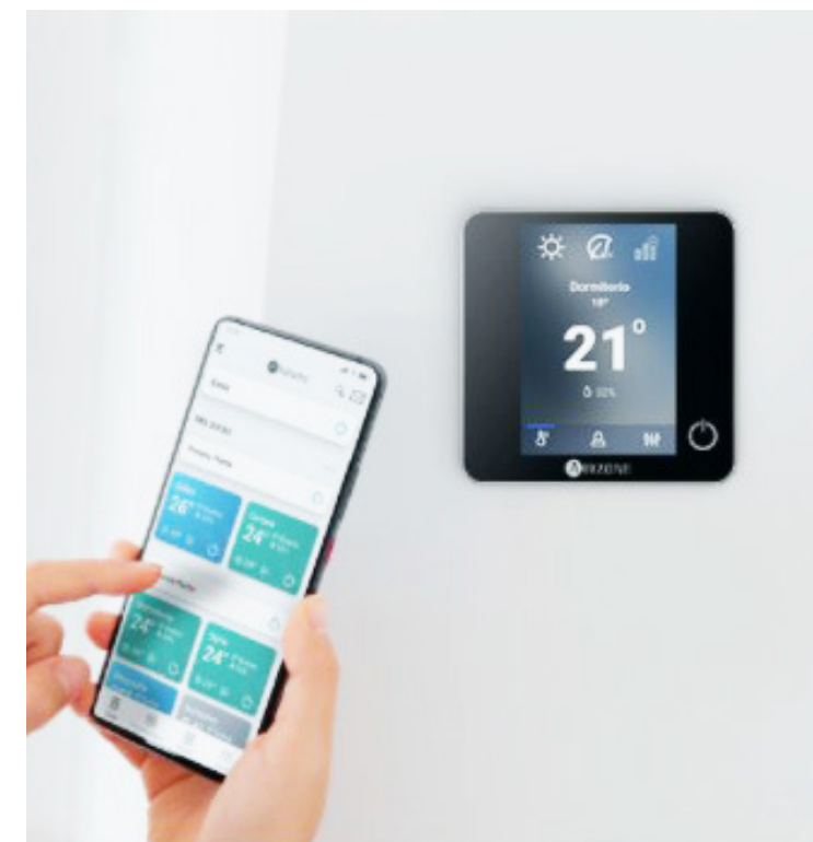
Sistema Airzone para el control de la climatización

Las bajantes y desagües en tubería de P.V.C. insonorizada.