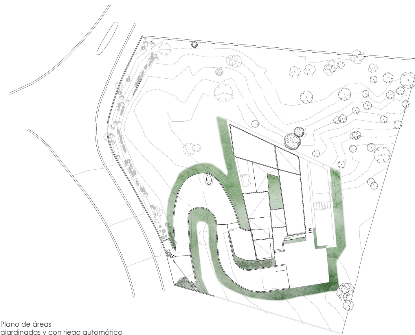
Plano de áreas ajardinadas y con riego automático

El suelo de la vivienda, terrazas y porches exteriores será de