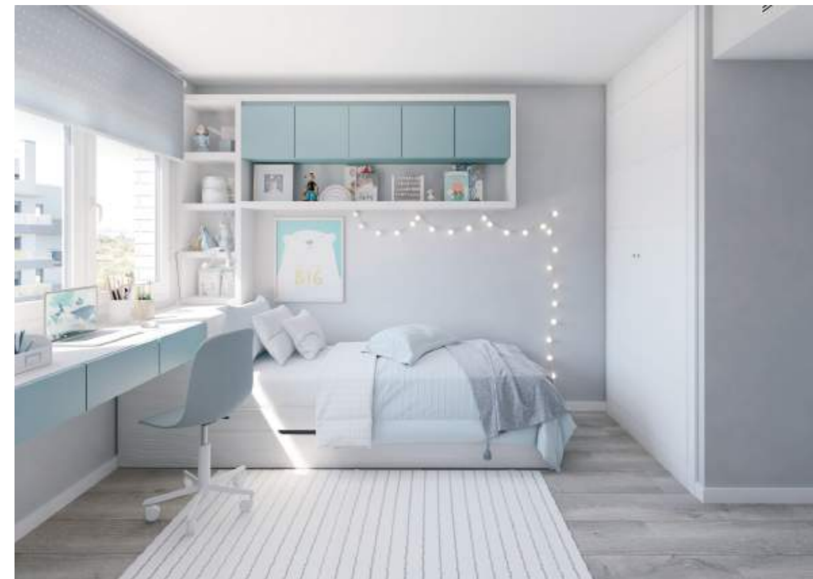
Dormitorios secundarios cómodos y funcionales donde los más pequeños también disfrutarán de su espacio privado.