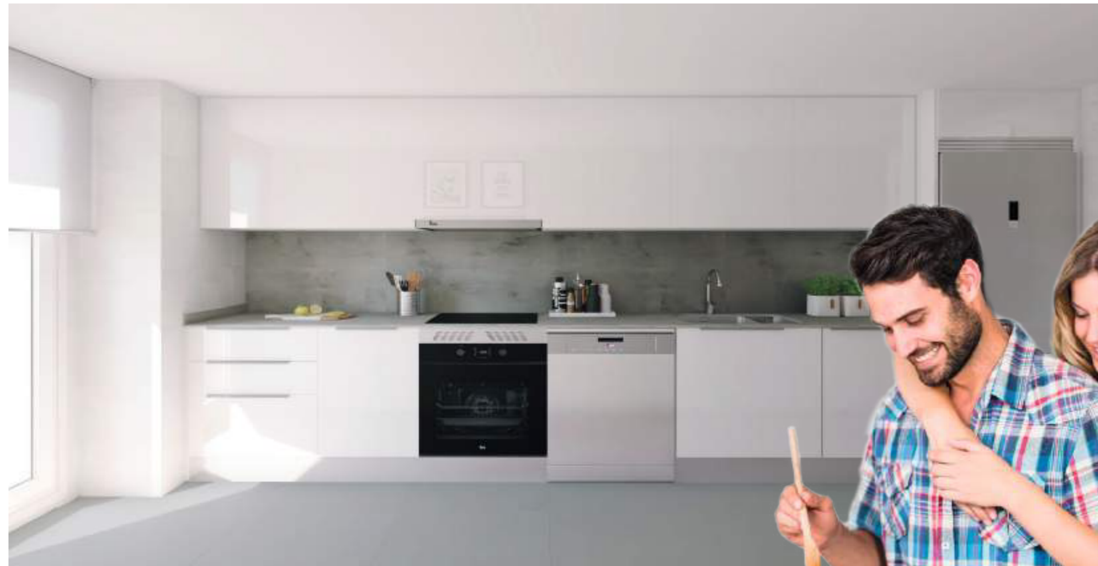
Cocinas prácticas y modernas amuebladas con electrodomésticos y concebidas para hacer más fácil las tareas diarias.