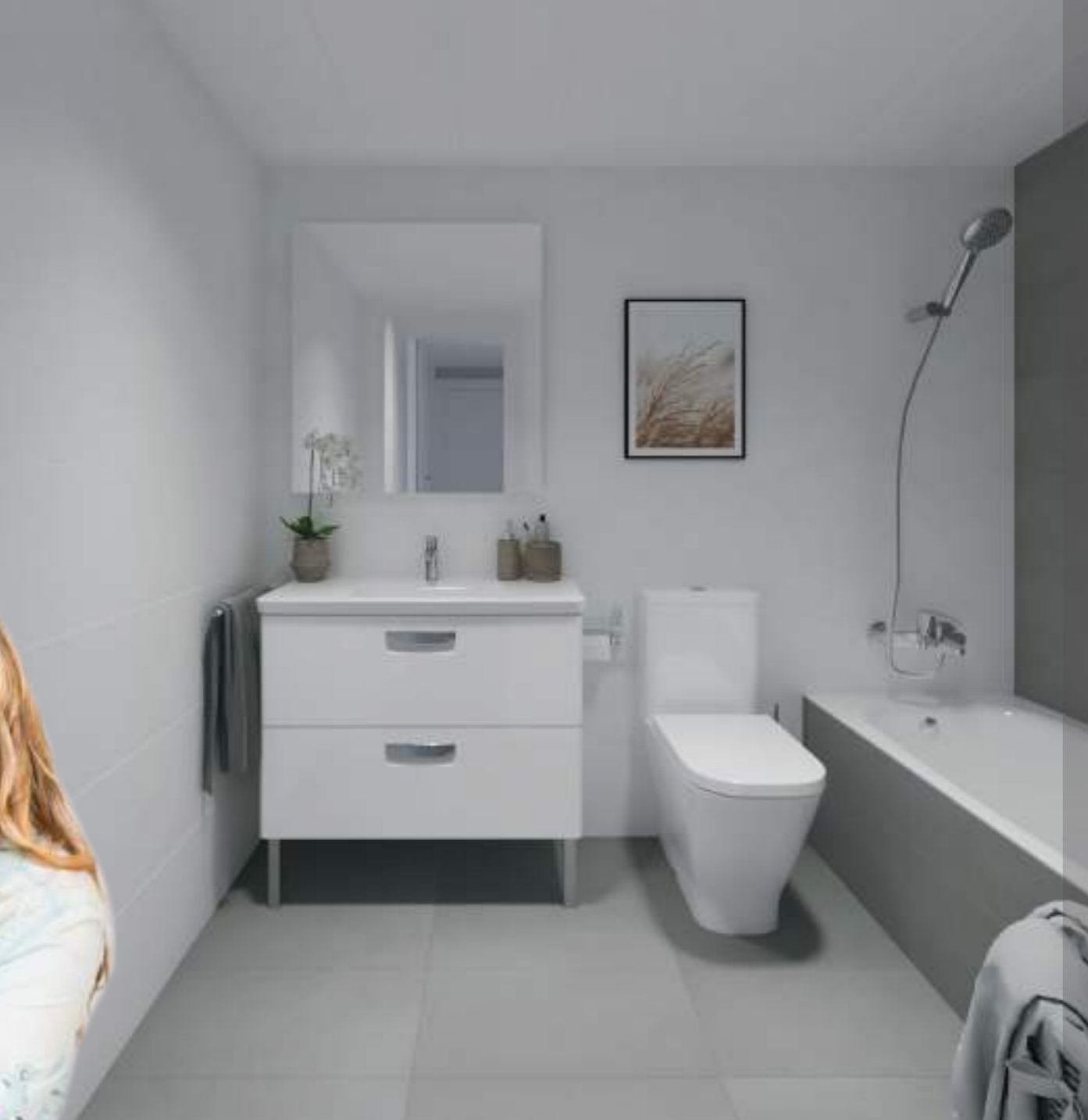
Cuartos de baño con materiales de primera calidad en suelos, alicatados y sanitarios.