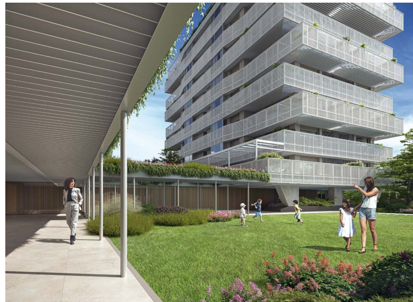
Contrastes de luces y sombras, y un cuidado paisajismo que invita al descanso al aire libre