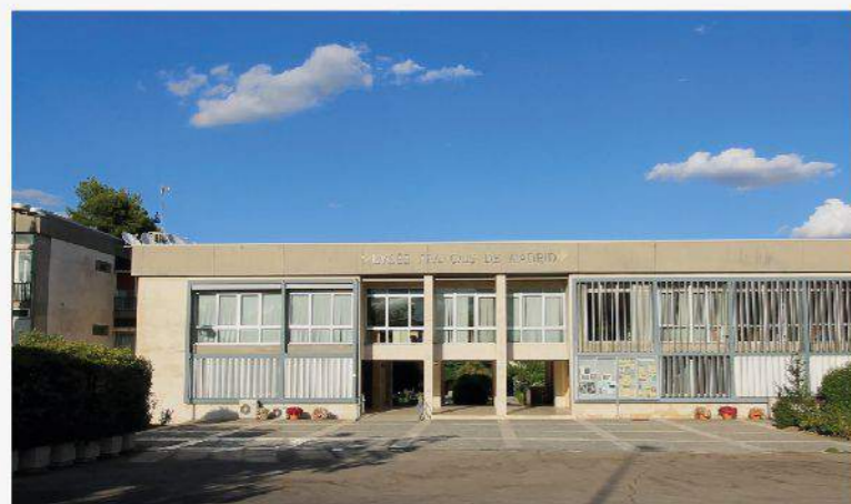
LICEO FRANCÉS DE MADRID