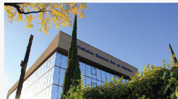
POLICLÍNICO NUESTRA SRA. DE AMÉRICA

Existe una gran cantidad de opciones educativas en la zona: El Liceo Francés, el colegio Santa María, Montessori, Brains y el Conservatorio de Música de la Comunidad de Madrid, ideal para familias con hijos en edad escolar.