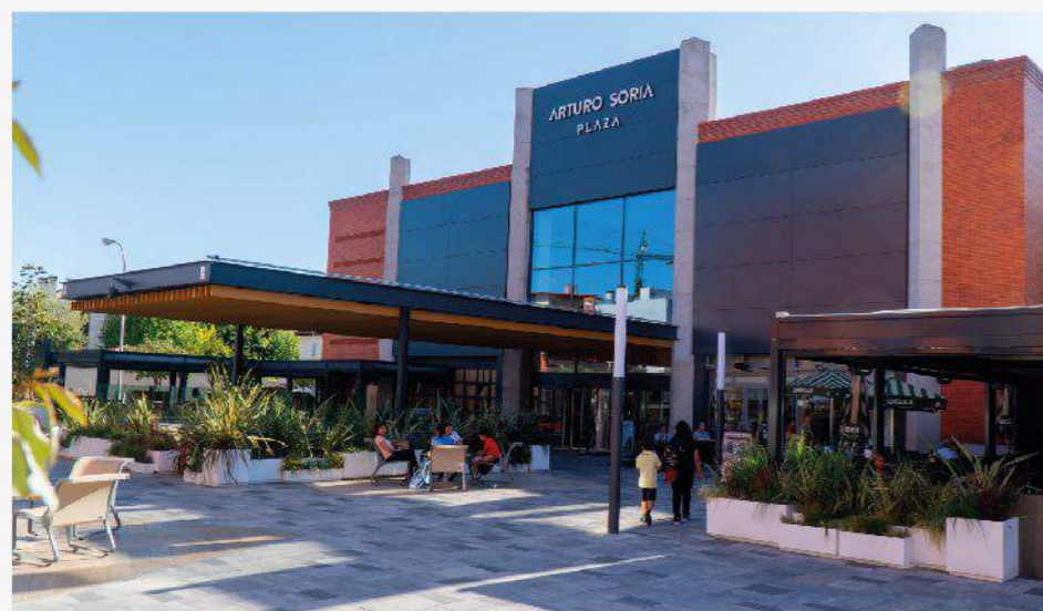
C.C. ARTURO SORIA PLAZA