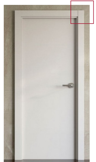
Aquesta imatge és una creació digital amb l'única finalitat de mostrar l'aparença de la promoció.

L'armari encastat al dormitori suite tindrà portes exteriors llises, en laca blanca, i tapajunts plans en "H" i interiors en melamina. També inclourà prestatge superior fixe i barra per penjar.