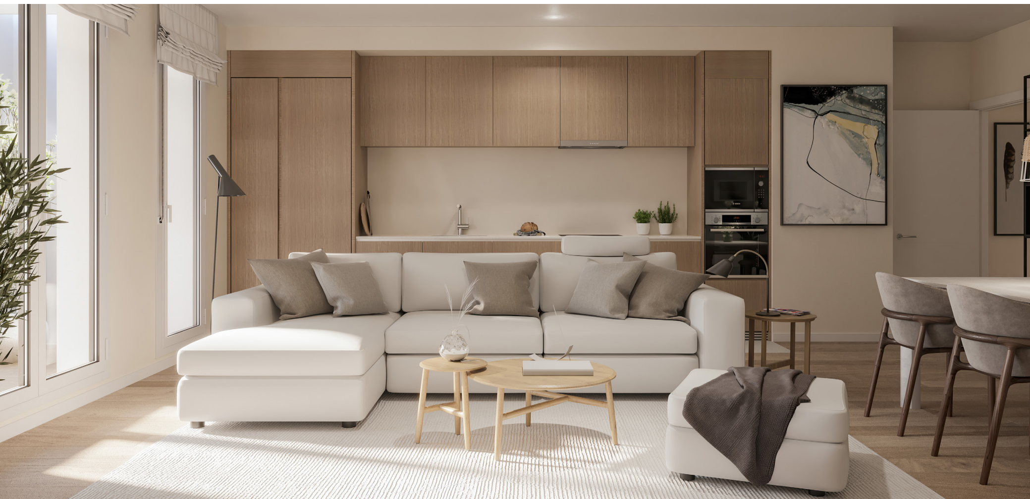
Interior de la vivienda. Acabados