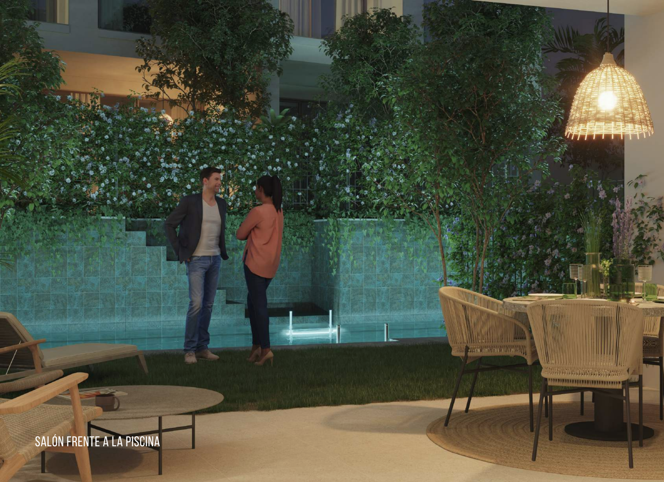
SALÓN FRENTE A LA PISCINA