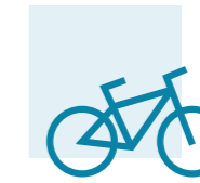
PARKING DE BICICLETAS