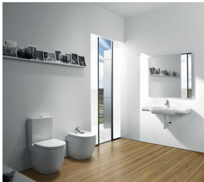
EJEMPLO MERIDIAN DE ROCA