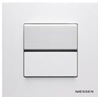
EJEMPLO ZENITH DE NIESSEN

- Pintura plástica lisa en todos los paramentos tanto verticales como horizontales.