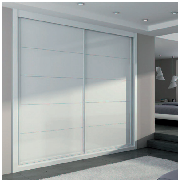
EJEMPLO ARMARIO DM LACADO BLANCO