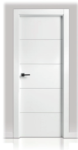
EJEMPLO DE PUERTA DM LACADO BLANCO