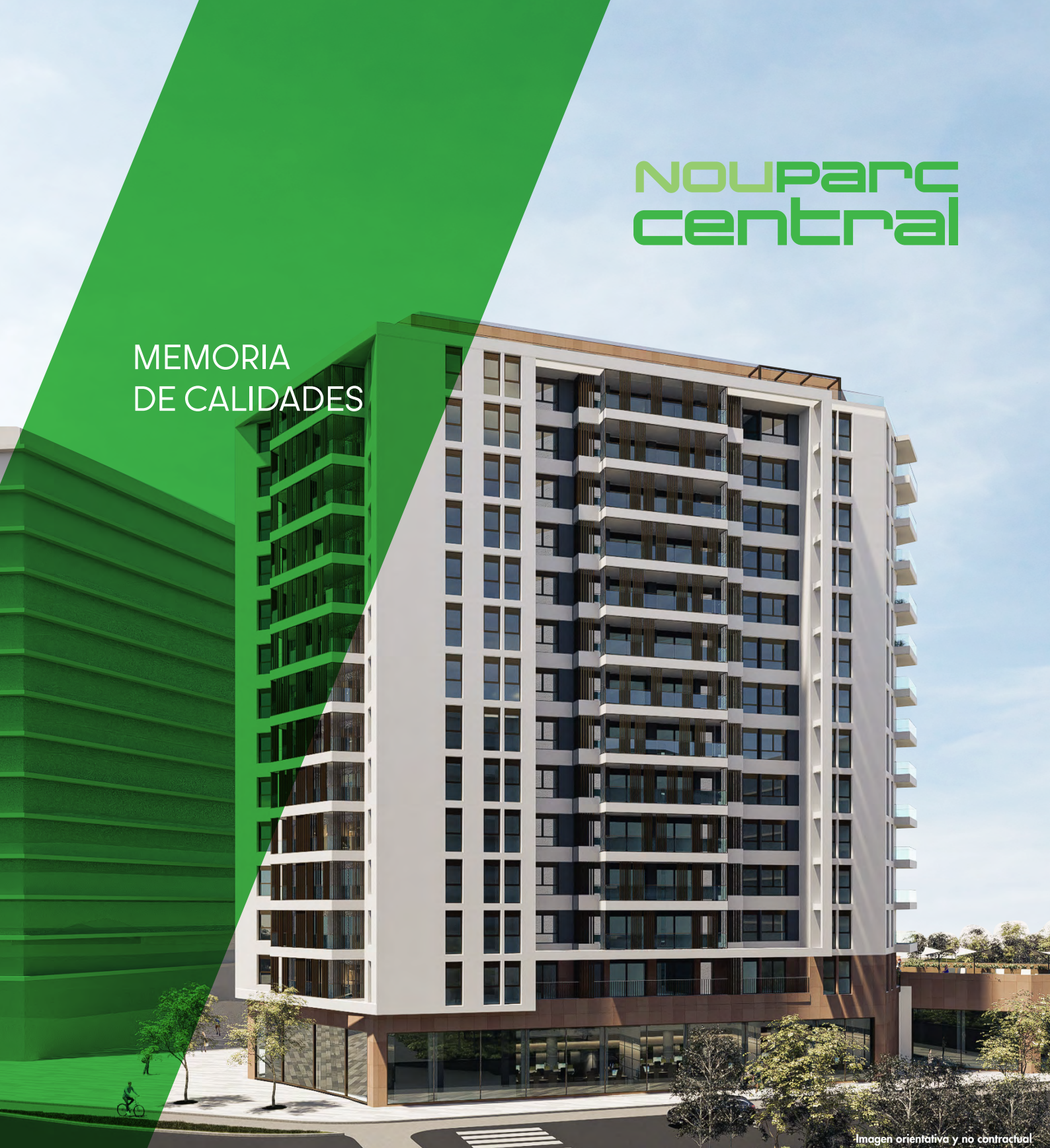
Imagen orientativa y no contractual