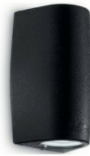
Iluminación LED Exterior LED lighting Exterior of property