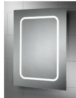
mampara de ducha y espejo led