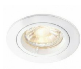
Iluminación LED Salón, comedor, dormitorios (3), pasillo LED lighting Lounge, dining area, bedrooms, hallway