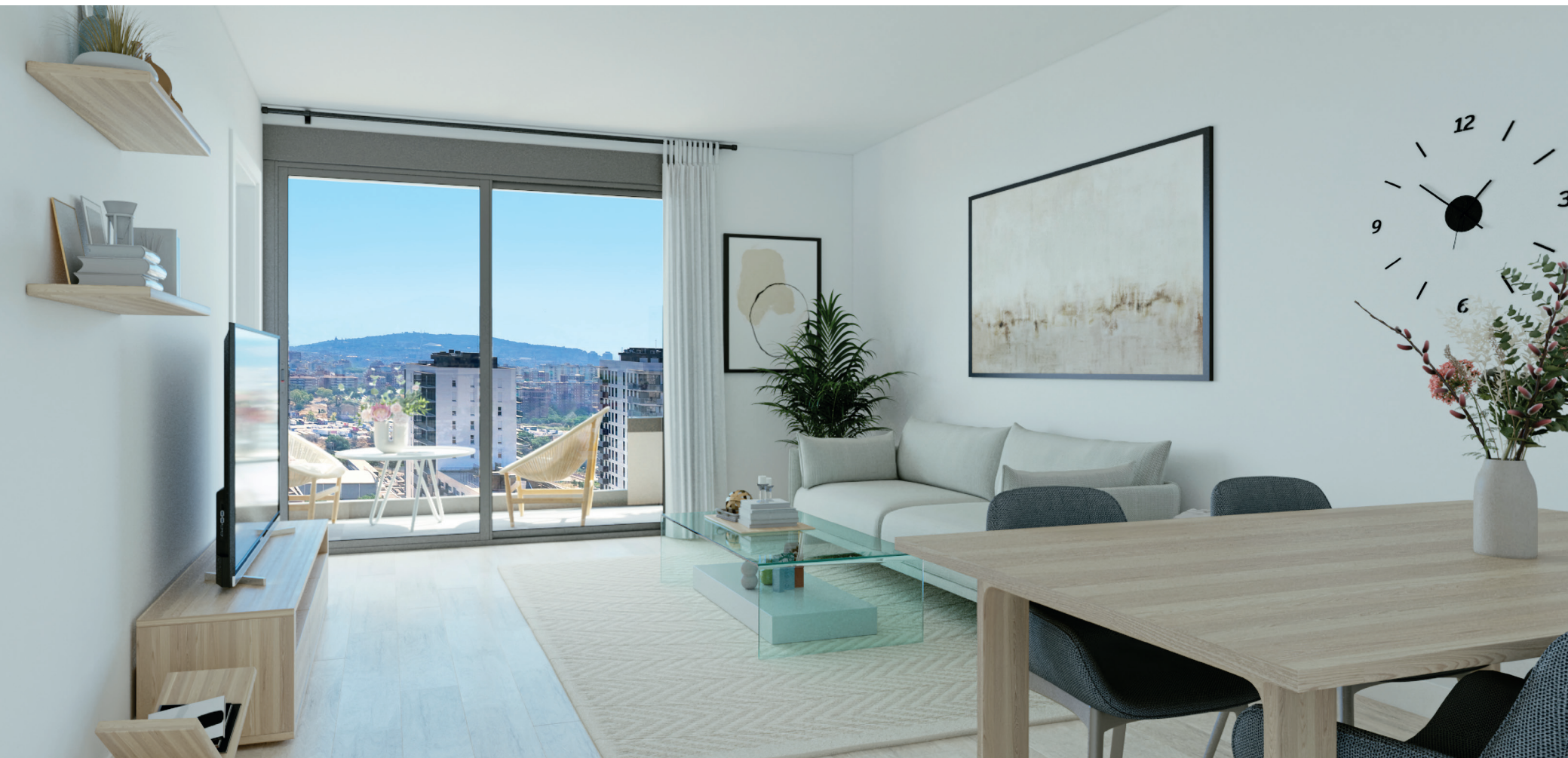
Interior de la vivienda. Acabados