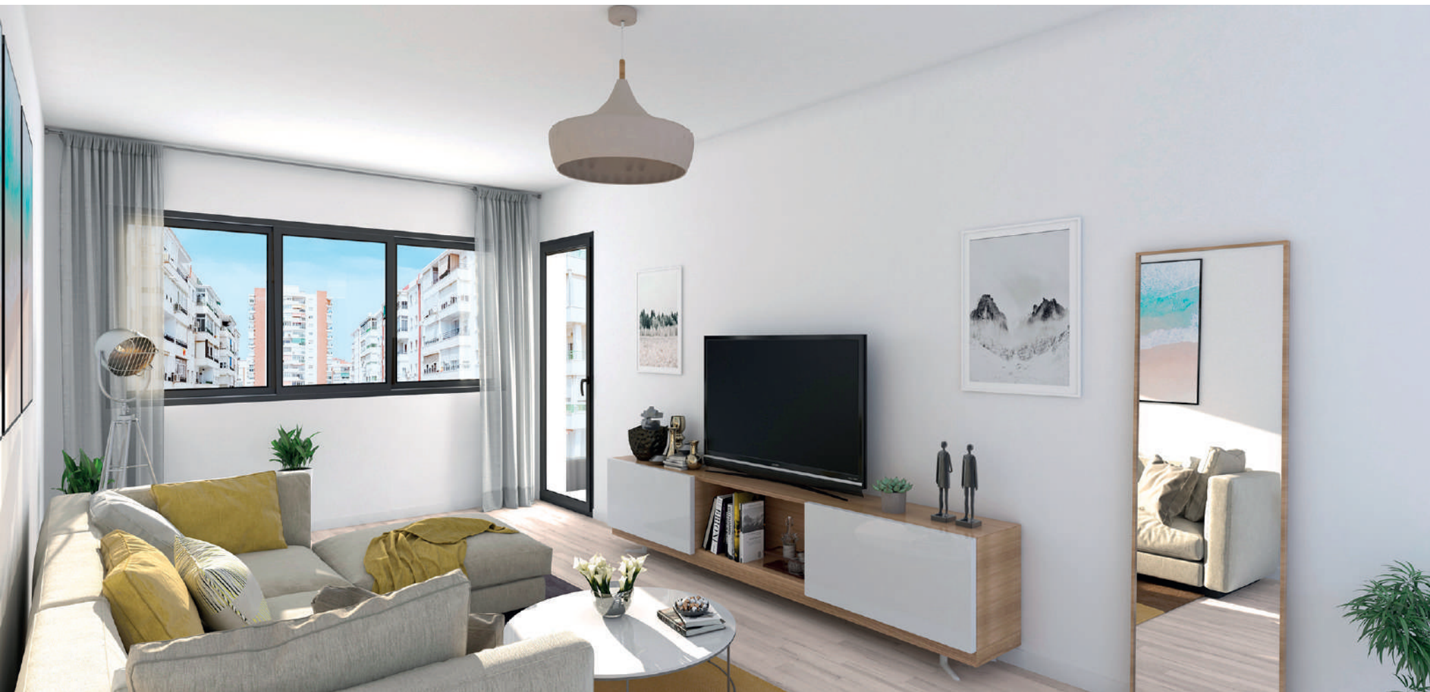
Interior de la vivienda. Acabados