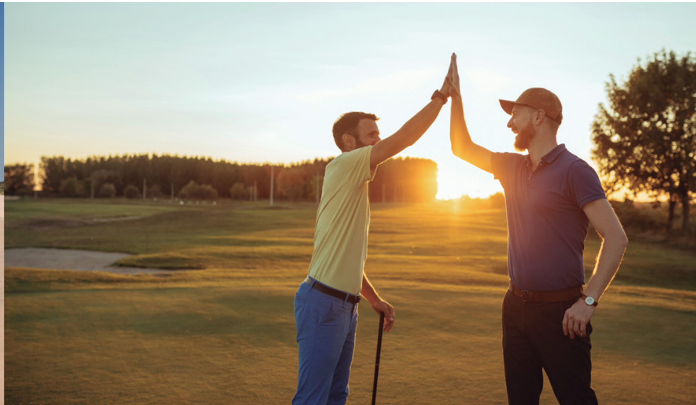
Foto / Campo de golf