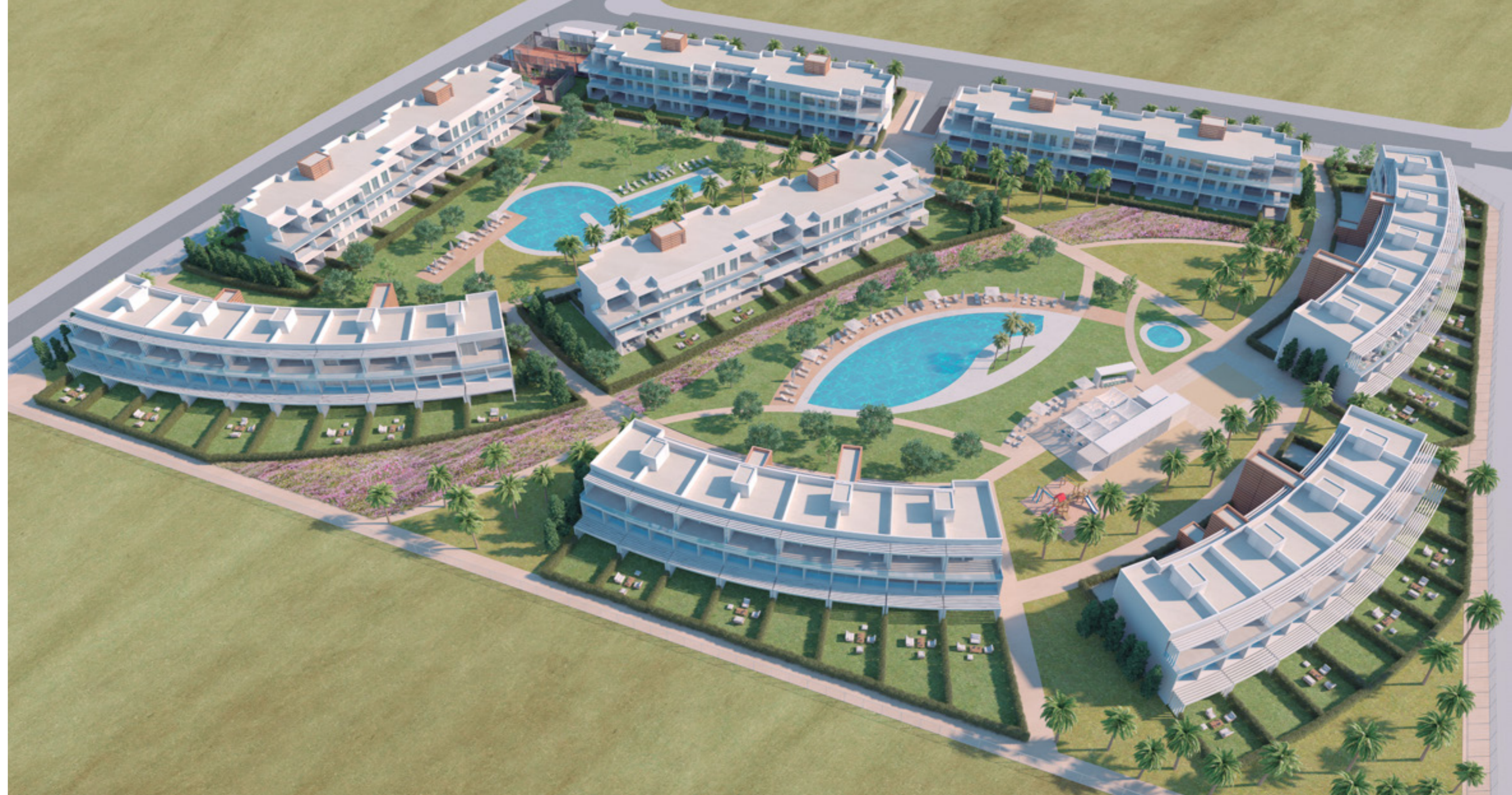
Foto / Vista aérea Playa Azul