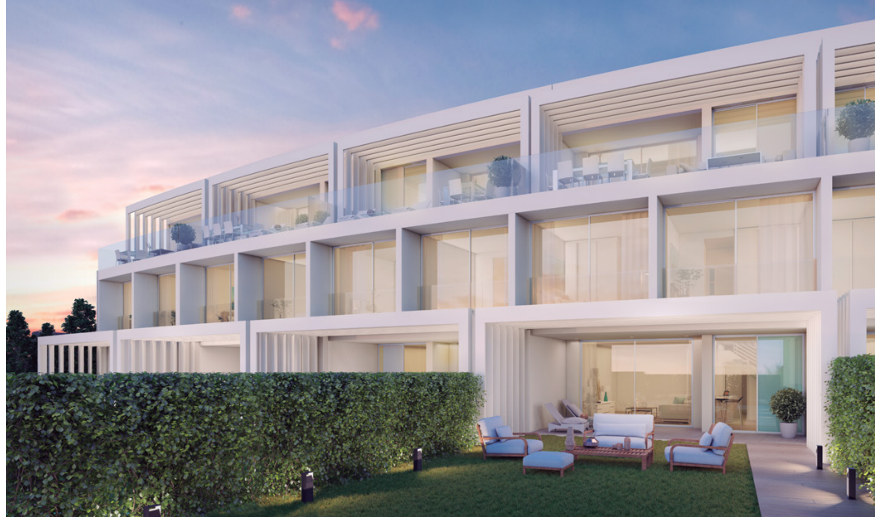
Foto / Fachada Playa Azul

68 viviendas de 2 a 4 dormitorios donde elegir entre apartamentos, áticos con solárium, bajos con jardín y dúplex con terraza y jardines