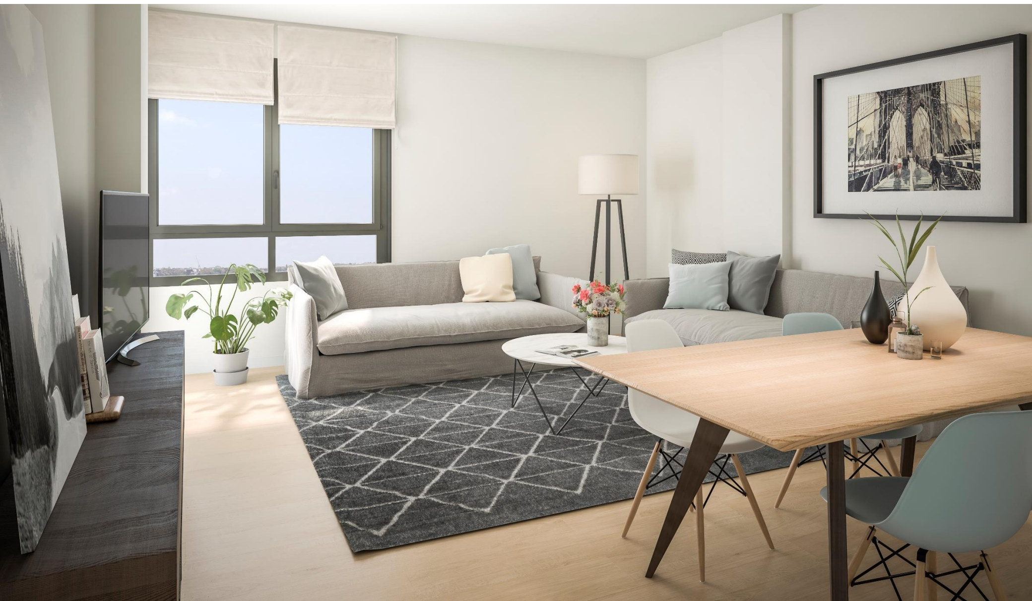
Interior de la vivienda. Acabados