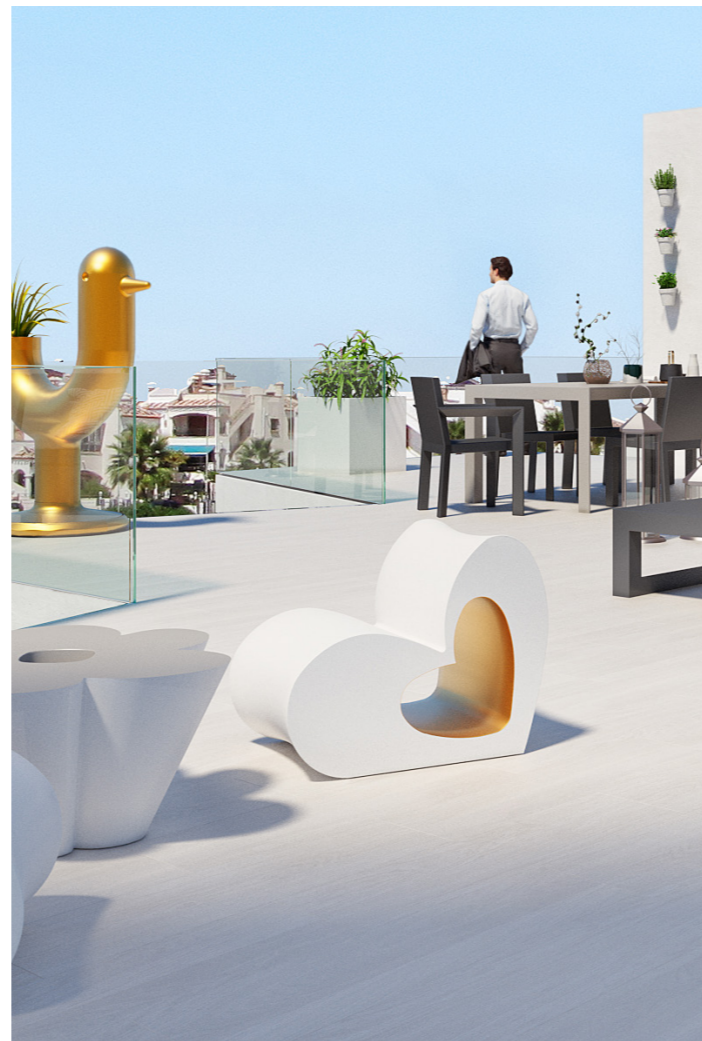
Fachada combinada en monocapa y piedra natural Combined façade rendering with natural stone.