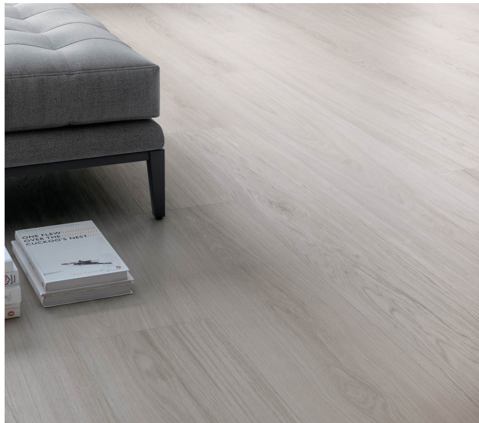
Pavimento interior porcelánico rectificado. MODELO: Davos Blanco (22,5x90), Pavimento exterior antideslizante. Davos Blanco (22,5x90 C3) Porcelain-stoneware rectified interior floor. Davos Blanco (22,5x90) Exterior anti-slip flooring. MODEL: Davos Blanco (22,5x90 C3)