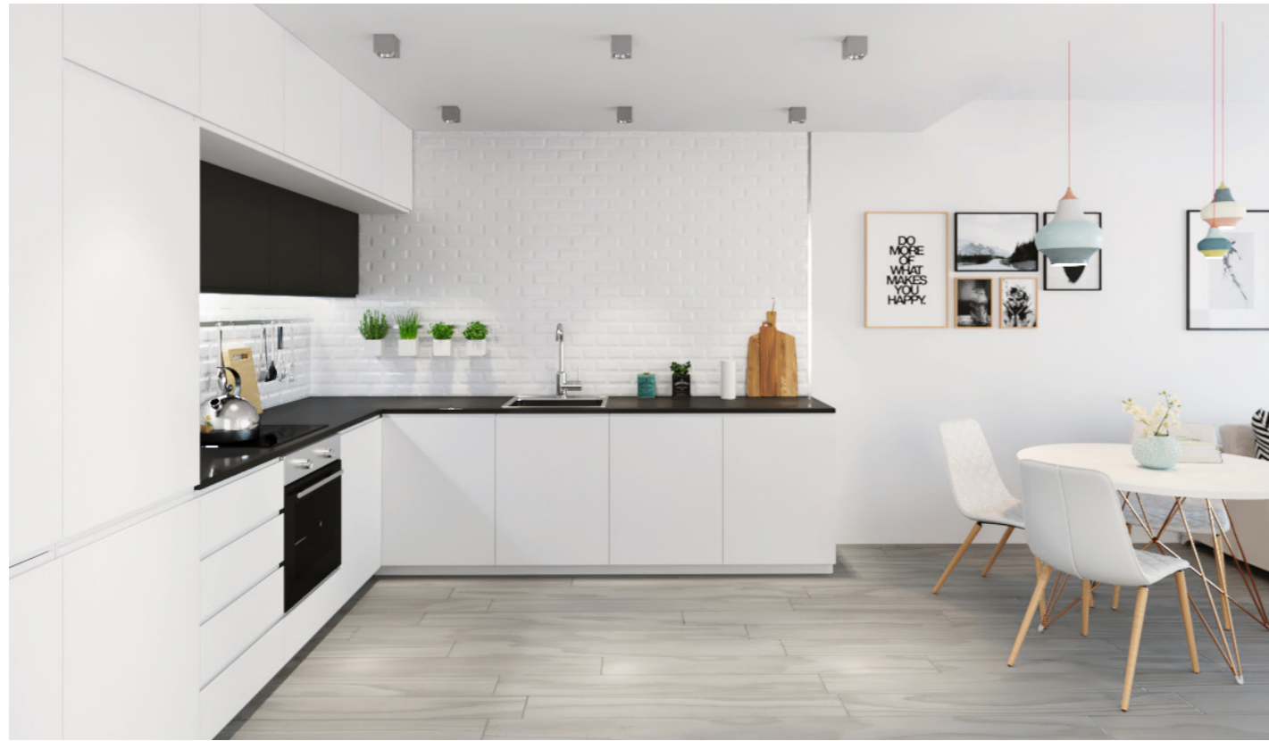
Cocina: Muebles bajos y columnas blanco mate, muebles altos en gris oscuro mate. Kitchen: Mate white low covers and columns, dark grey mate high covers.