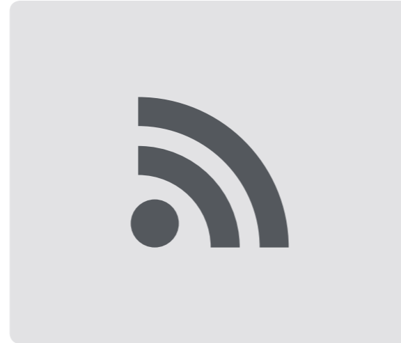
Preinstalación de telecomunicaciones según normativa (2 líneas de teléfono, tv por cable, vía satélite e interfono). Pre-installed telecommunications network in accordance with the law (2 telephone lines, cable tv, satellite tv and intercom).