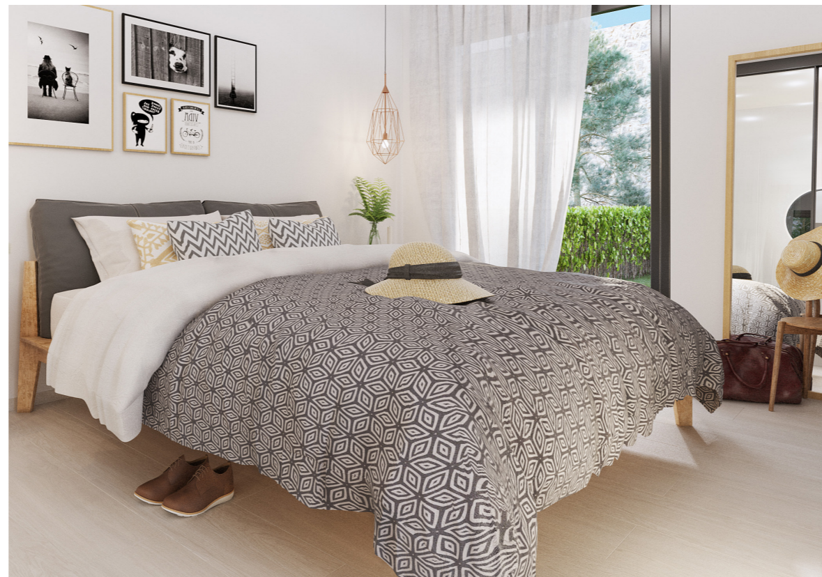
Pintura acabado liso blanco roto. Smooth White flat finish Paint.