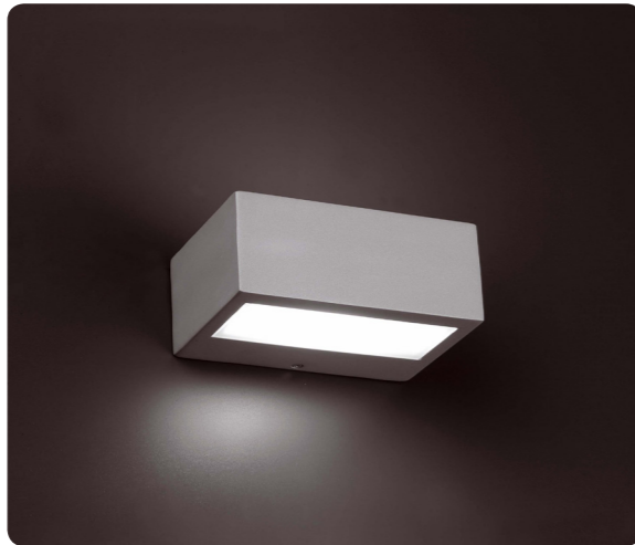
Luces exteriores incluidas en terraza y solarium Exterior lights included on the terraces & solarium