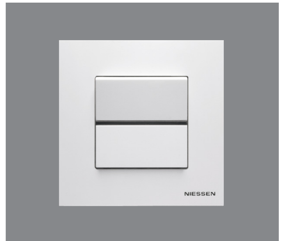
Mecanismos Zenit de NIESSEN. Zenit from NIESSEN electric fittings.