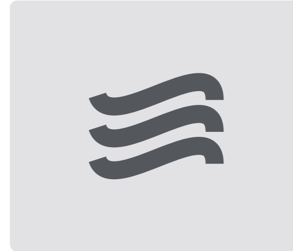
Instalación de agua caliente por aerotermia, con acumulador y calentador eléctrico. Hot water system powered by aerothermia with deposit and electrical boiler.