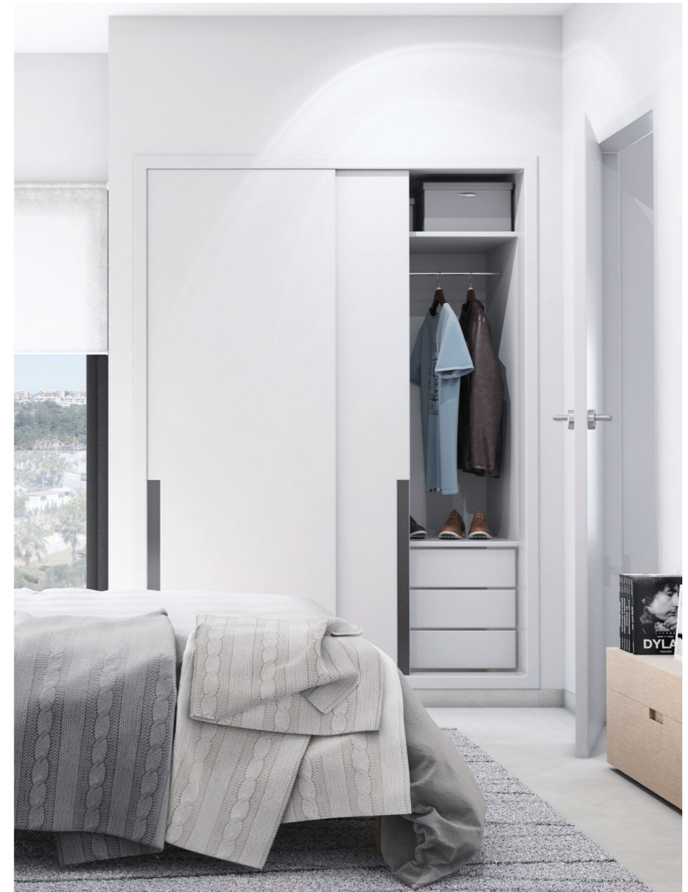
↑ Armarios empotrados con puertas correderas. Cajoneras incluidas. Built in wardrobes with sliding doors. Drawers included.