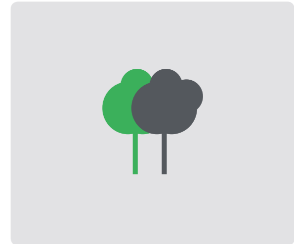
Edificio construido según normativa de eficiencia energética. Building constructed in accordance with the last energy efficiency standards.

AVISO LEGAL IMPORTANTE: PATRIMI RESORTS, S.L. manifiesta que todo el material publicitario (tal como planos, imágenes, animaciones 3D, renders, videos, folletos, etc.) que se utiliza para la actividad de promoción de la venta de las viviendas, cumplen una función de mera presentación orientadora de las características que tendrá la vivienda una vez terminada. PATRIMI RESORTS, S.L. quedará exenta de cualquier responsabilidad frente al comprador si, en la fecha de la entrega, la vivienda presente diferencias respecto a dichos planos, imágenes y animaciones en aspectos decorativos y de acabado final, que no afecten elementos estructurales de la vivienda.