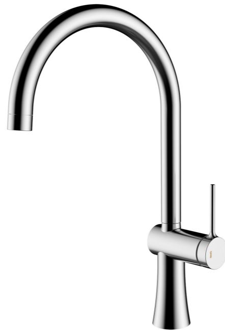
Grifo FEMME de RGB. FEMME GRB mixer tap.