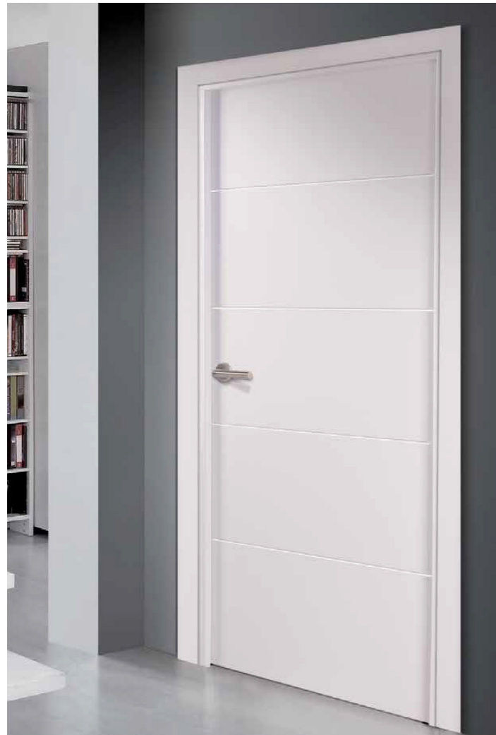
↑ Puertas de paso lacadas en blanco con cierre imantado White lacquered interior doors with magnetized lock