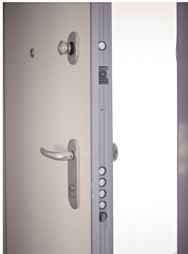
Puerta de entrada a vivienda acorazada con cerradura de seguridad. Main Entrance armored door fitted with security lock.