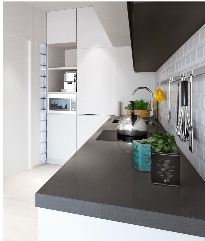
Encimera Quarz Compac gris Grey Quarz Compac worktop.