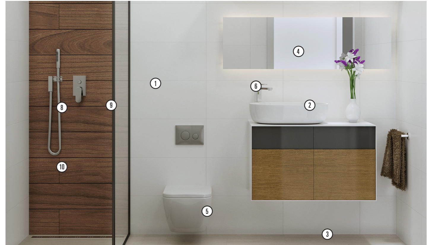
Bathroom | 30x60 rectified white tiles (1). Sink over wooden hanging bicolor bathroom furniture(2). Davos blanco imitation wood flooring and italian shower (3). Mirror included (4). LE FIABE toilet with built in tank GEBERIT (5). High pipe mixer tap model GLITTER (6). Curved tap (7). Shower tap model GLITTER with pull out spray (8). Shower sreen included (9). Porcelain imitation wood (10). Varnished blue tiles (11). Ligth over the mirror in the main bathroom.