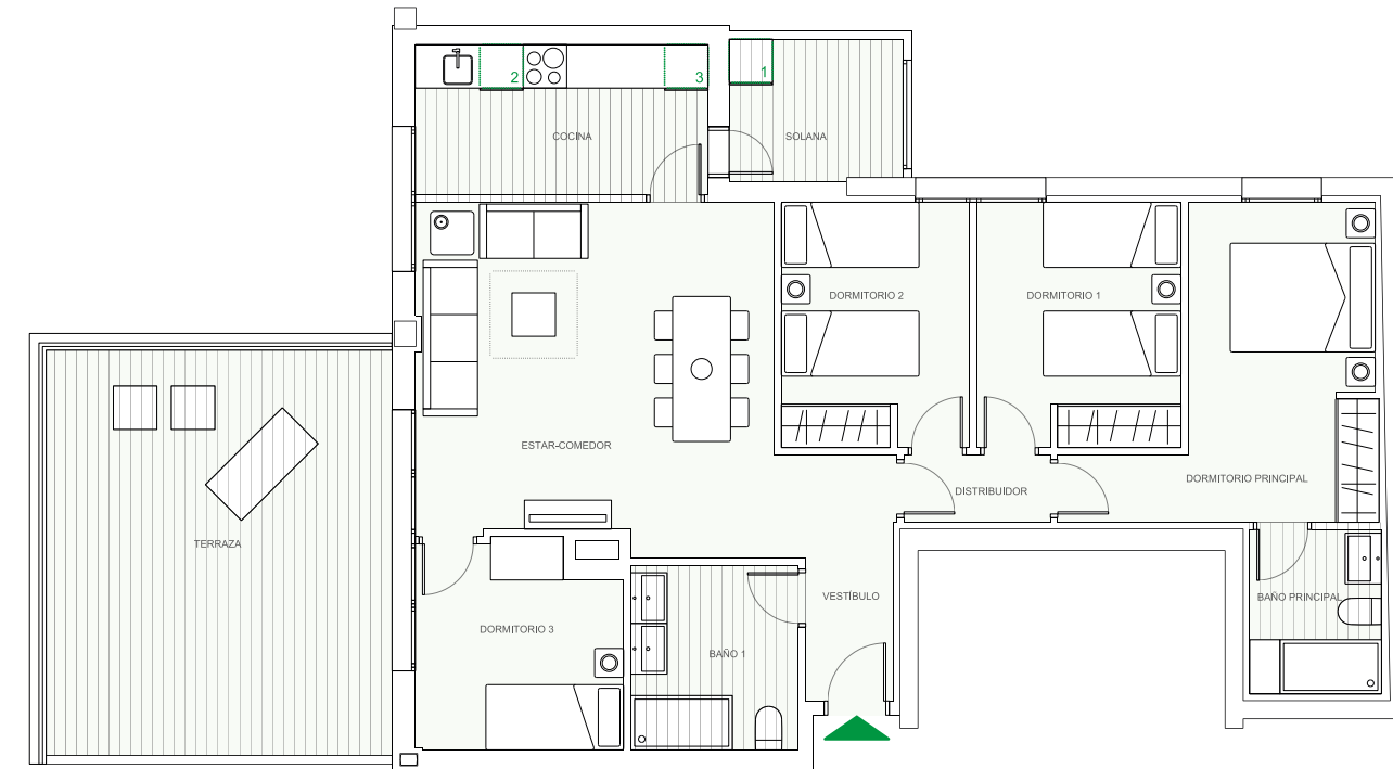
PISO 4 DORMITORIOS