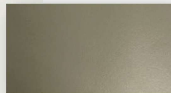
Mueble color musgo grisáceo