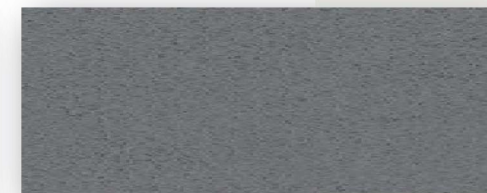
Encimera color plomo