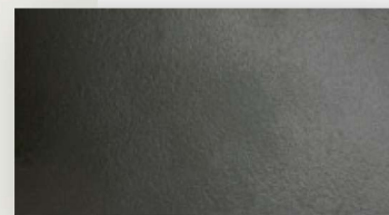
Mueble color gris grafito