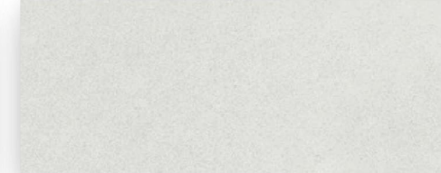
Encimera color alaska