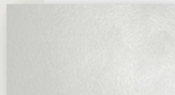
Mueble color blanco