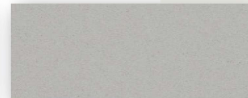
Encimera color ceniza