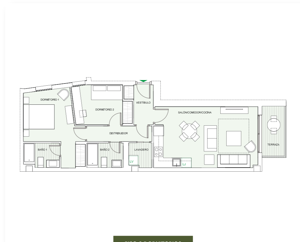
PISO 2 DORMITORIOS