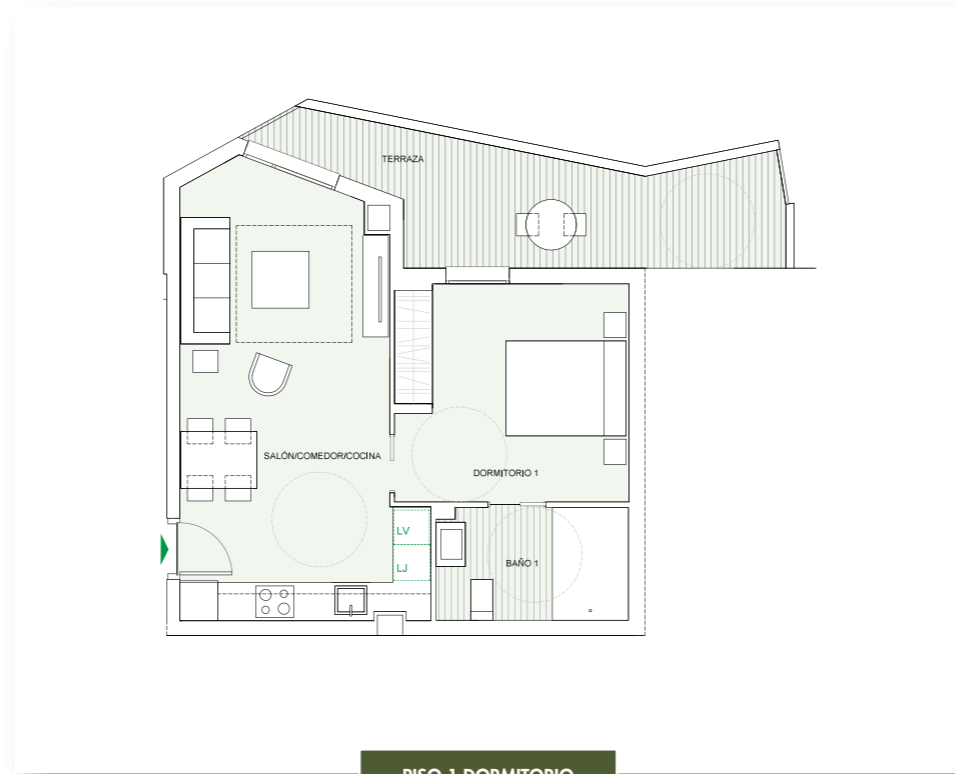
PISO 1 DORMITORIO