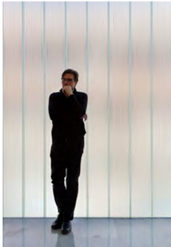
Víctor García Martínez Arquitectos

Materialmente los edificios se resuelven con una precisión y lógica constructiva actual y sostenible, pero manteniendo lazos con las preexistencias del lugar. Lo vinculan cromáticamente con la casa rural y con los recursos propios de la arquitectura tradicional y vernácula, como la utilización de lamas correderas con función de filtro solar.