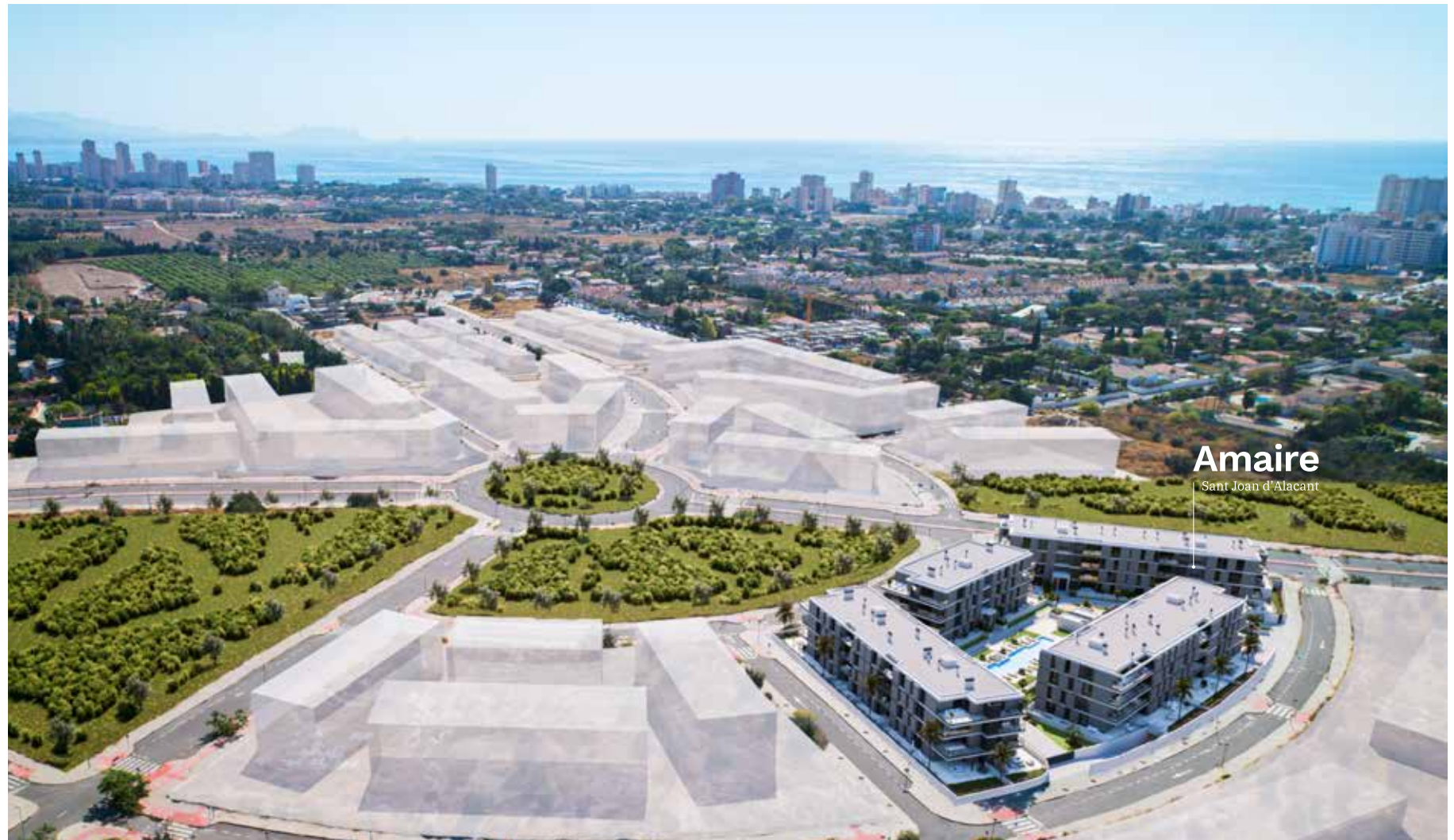
Amaire Sant Joan d'Alacant

Si prefieres dejar el coche en la plaza de garaje de tu nueva casa en Amaire , en las proximidades de la urbanización podrás coger el tranvía para disfrutar del centro de Alicante en tan solo unos minutos.