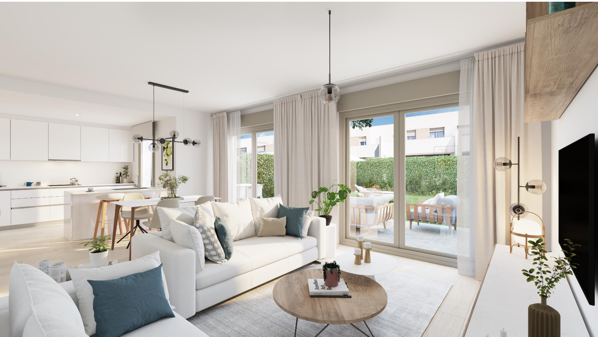
Interior de la vivienda. Acabados