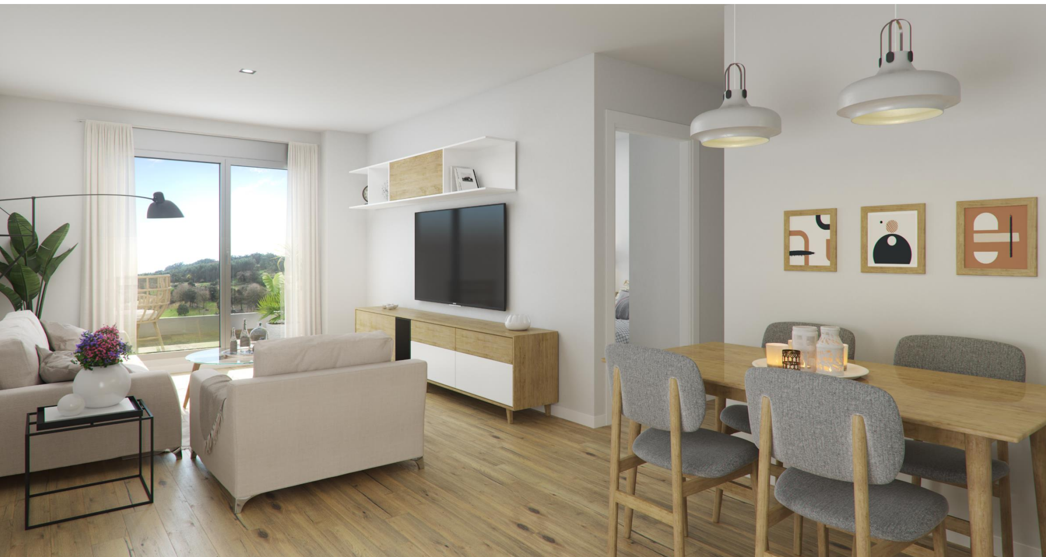
Interior de la vivienda. Acabados