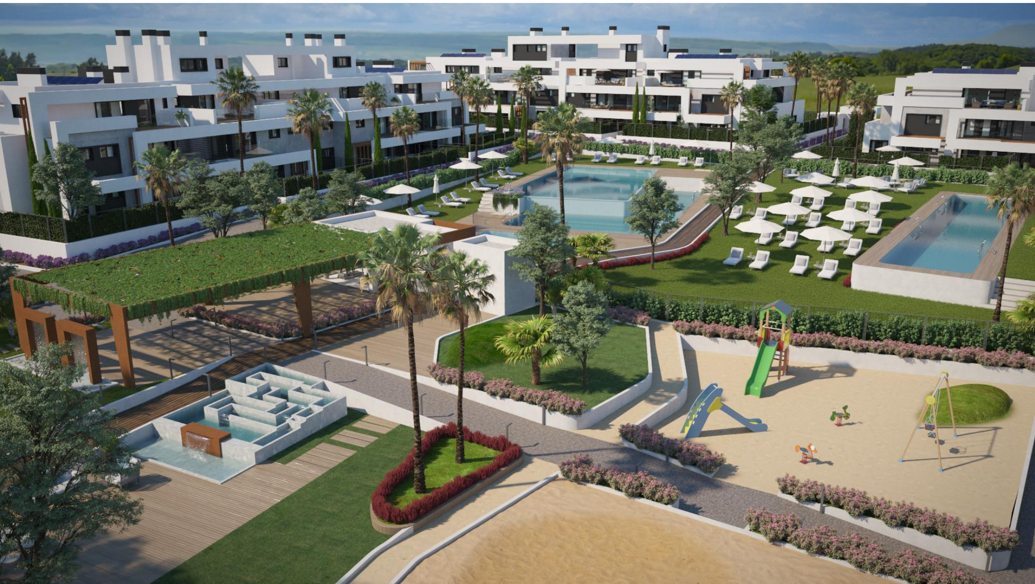
Urbanización y Zonas Comunes