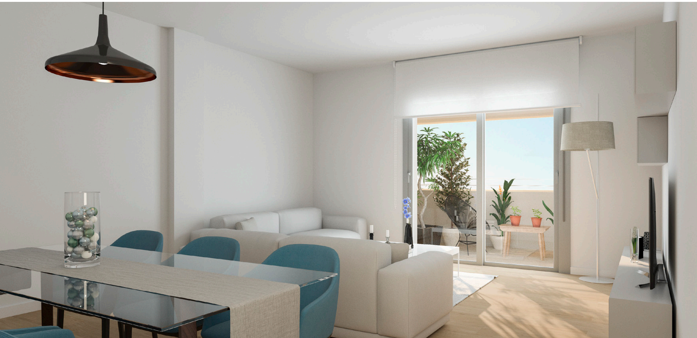
Interior de la vivienda. Acabados