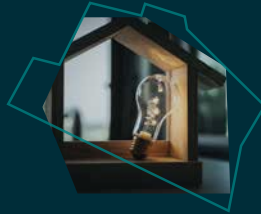
Destino Innovación Destinació Innovació