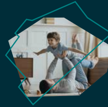
Destino Experience Destinació Experience