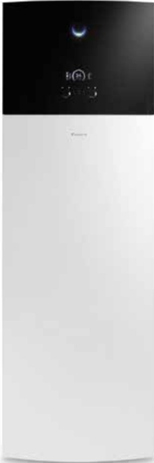
Bomba de calor aerotèrmica d'aigua calenta sanitàària. Bomba de calor aerotèrmica de agua caliente sanitaria. Aerothermal hot water sanitary heat pump.