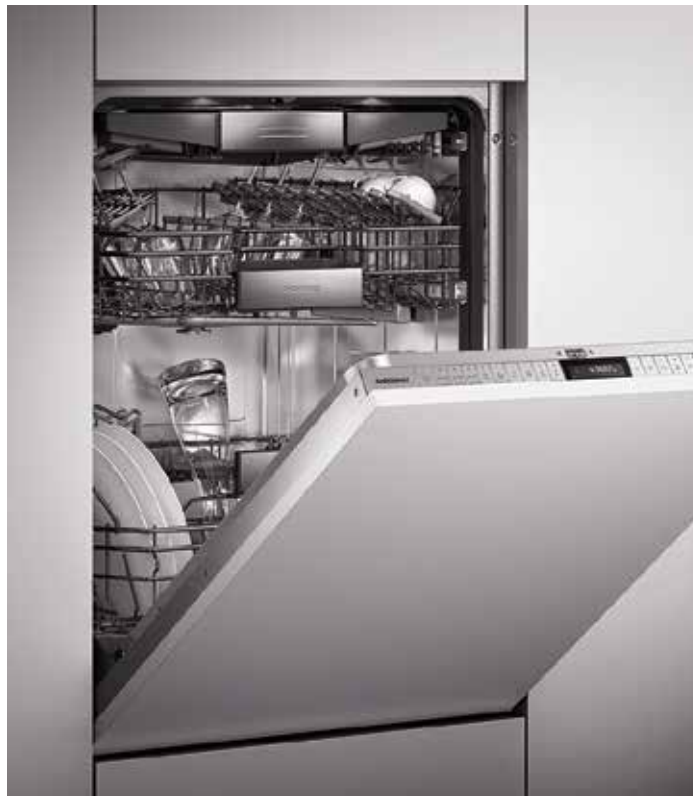
Lavavajillas Lavavajillas panelado Gaggenau.