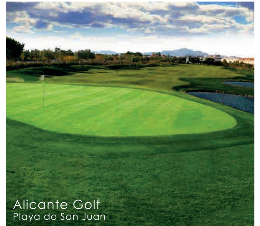
Alicante Golf Playa de San Juan