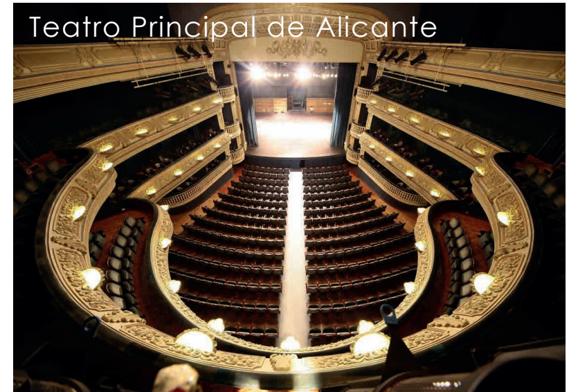
Teatro Principal de Alicante