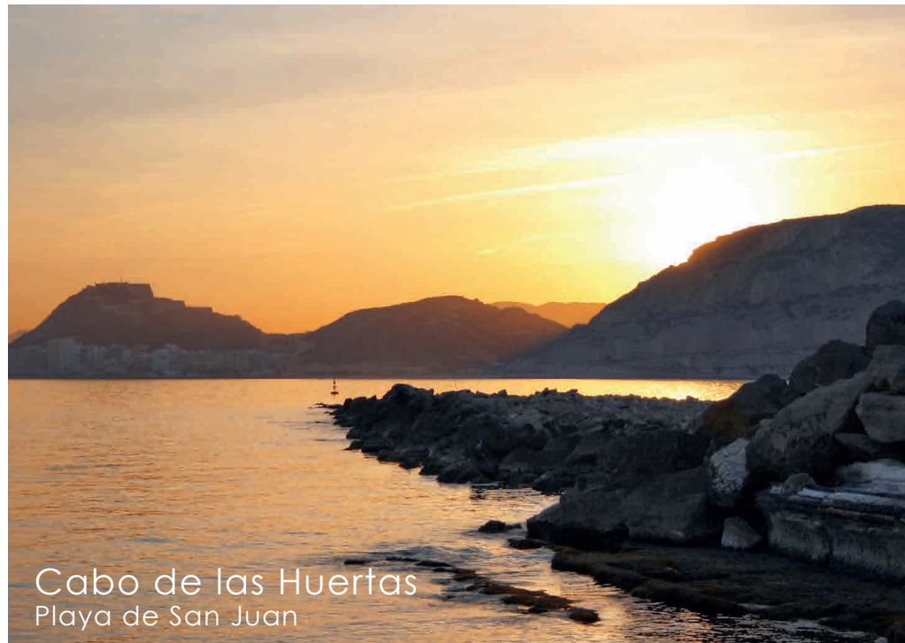
Cabo de las Huertas Playa de San Juan