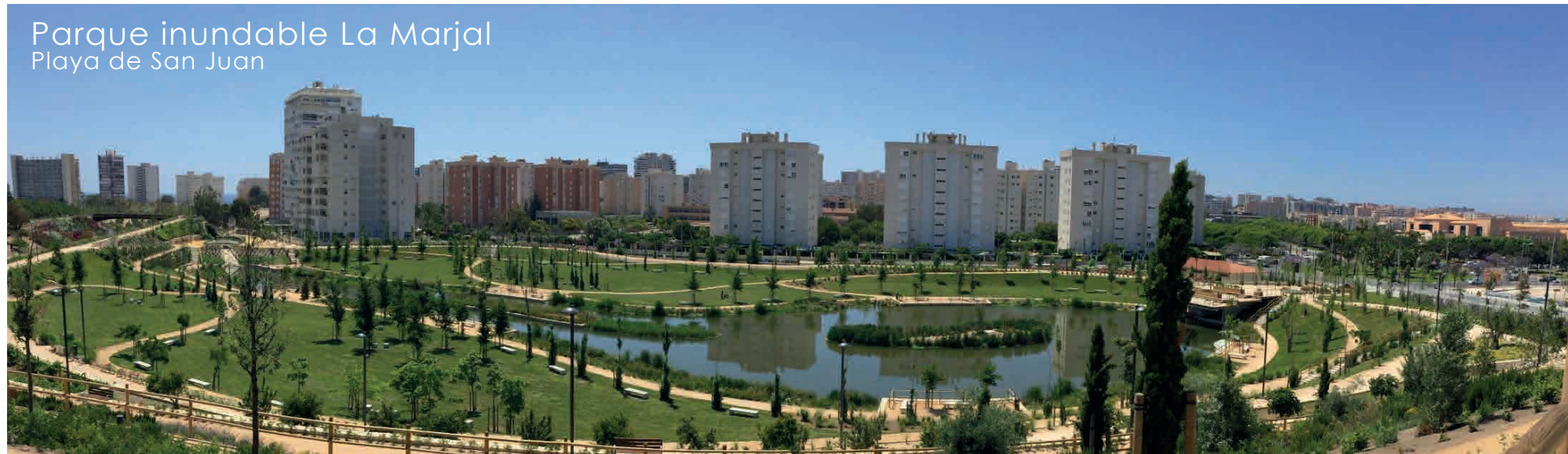
Parque inundable La Marjal Playa de San Juan