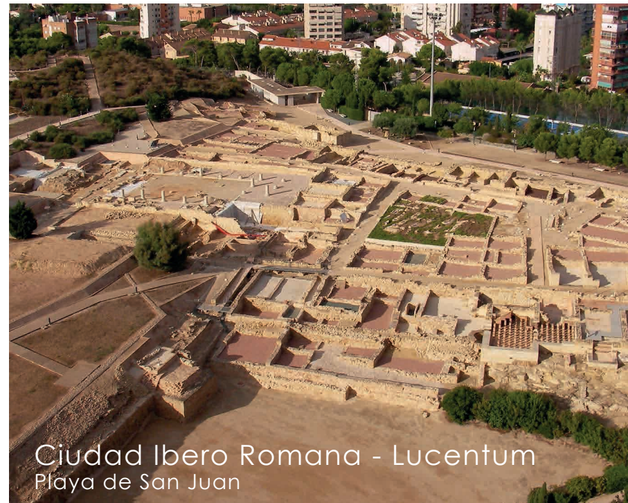
Ciudad Ibero Romana - Lucentum Playa de San Juan