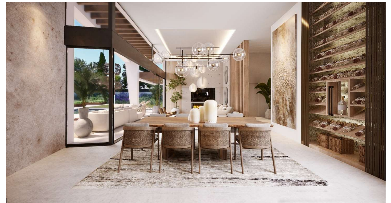
Imagen figurativa no vinculante. Propuesta de decoración opcional.

La decoración representada en las imágenes mostradas son parte de la propuesta opcional de interiorismo.