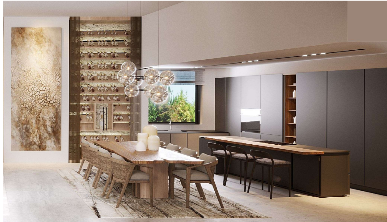
Imagen figurativa no vinculante. Propuesta de decoración opcional.

Cocina de diseño completa, de la marca Dica o similar equipada con electrodomésticos Neff . Los frentes lacados mate en color gris noche, extremadamente resistentes y muy fáciles de limpiar e higiénicos, se han combinado, con estantería y barra sobre encimera en color Olmo Natur.