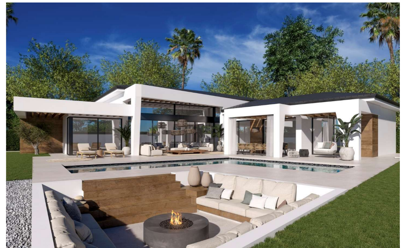
Imagen figurativa no vinculante. Propuesta de decoración opcional.