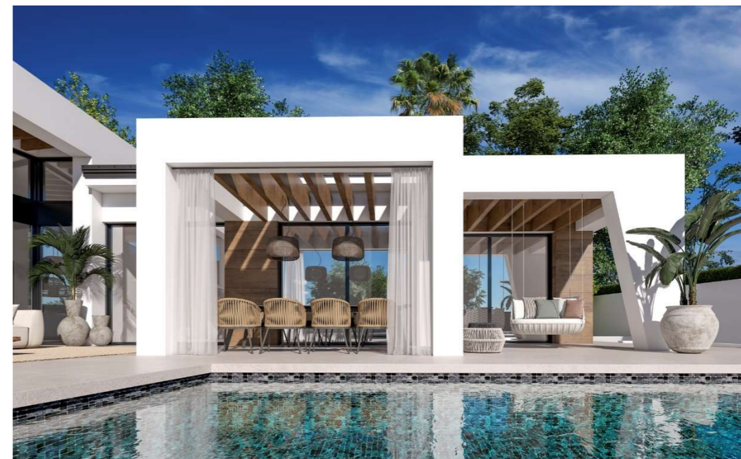
Imagen figurativa no vinculante. Propuesta de decoración opcional.