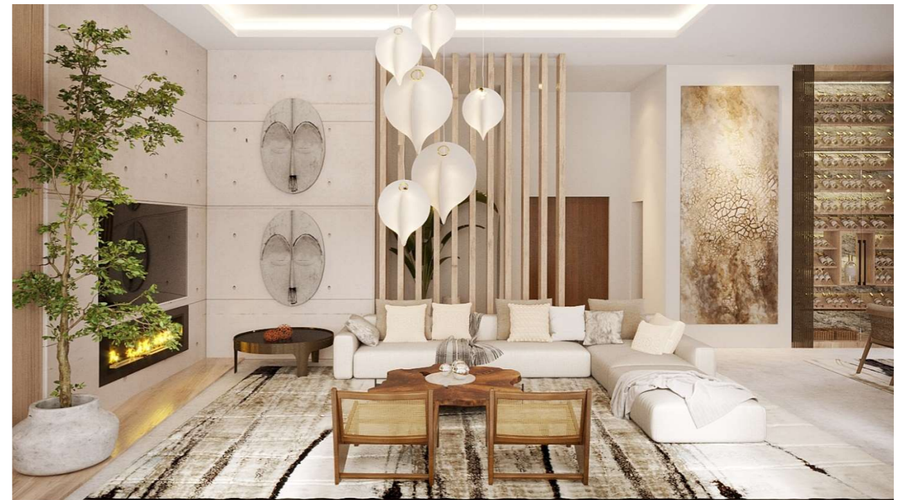
Imagen figurativa no vinculante. Propuesta de decoración opcional.