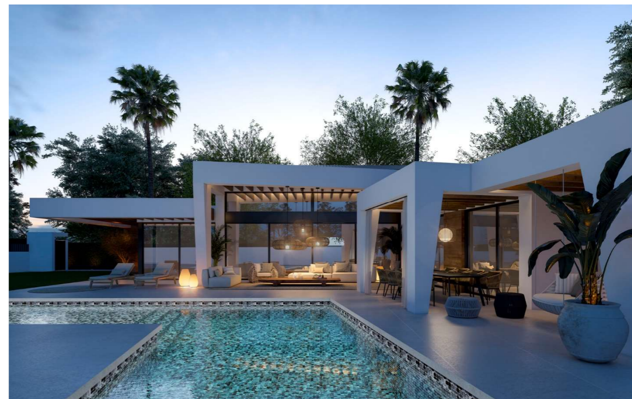
Imagen figurativa no vinculante. Propuesta de decoración opcional.