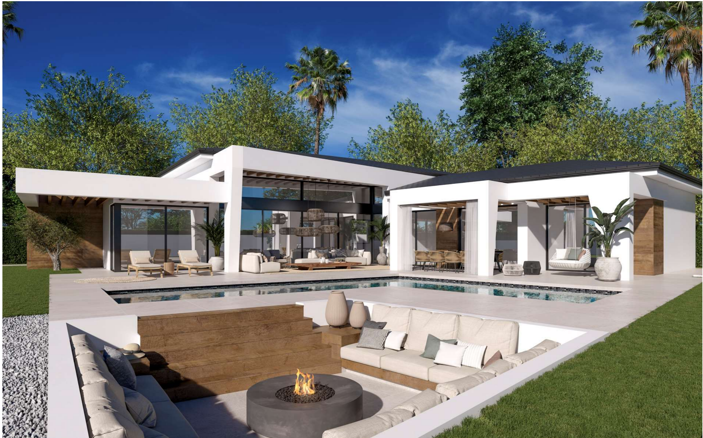
Imagen figurativa no vinculante