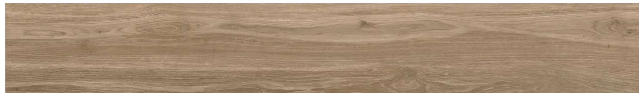
Origin Umber 22,5 x 180 cm

En dormitorios, tanto principal como secundarios, se dispondrá en gres porcelánico rectificado con terminación efecto madera Origin Umber 22,5 x 180 cm según imagen adjunta.