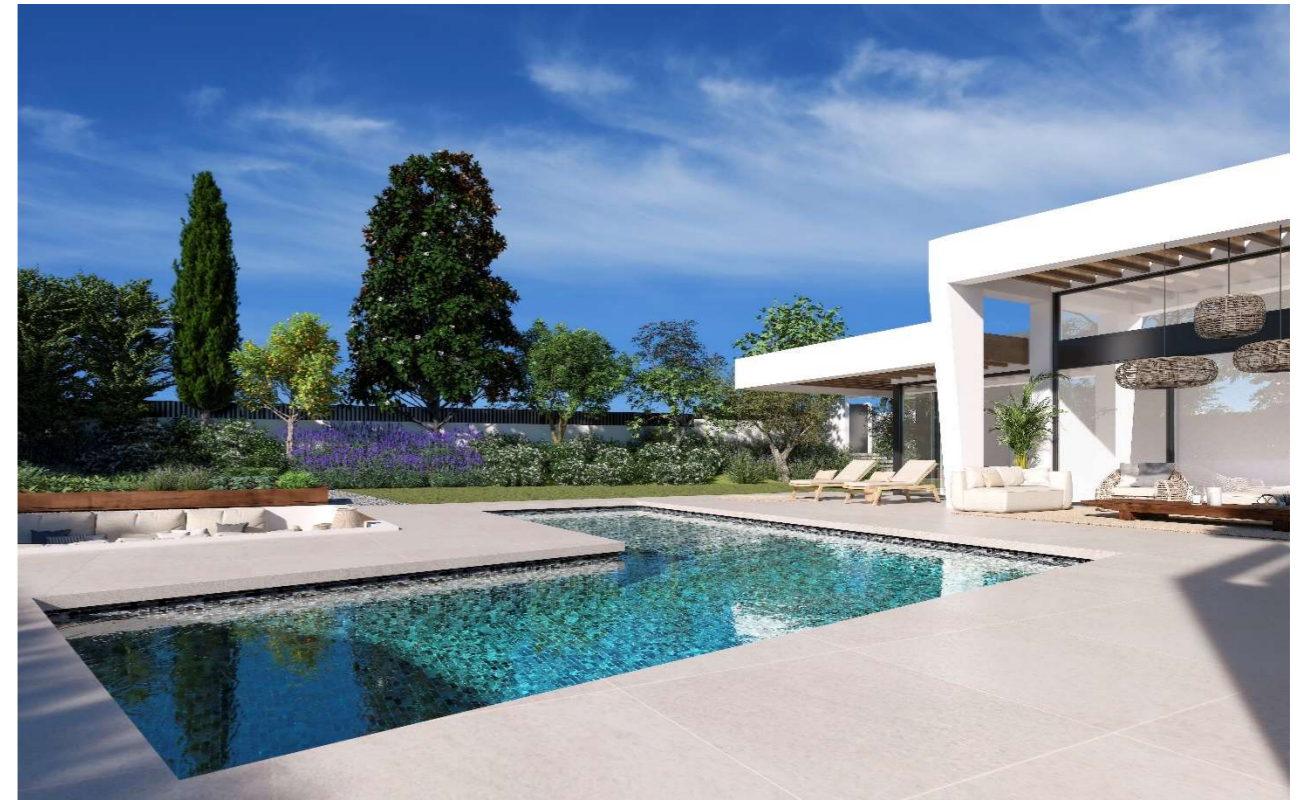
Imagen figurativa no vinculante. Propuesta de decoración opcional.