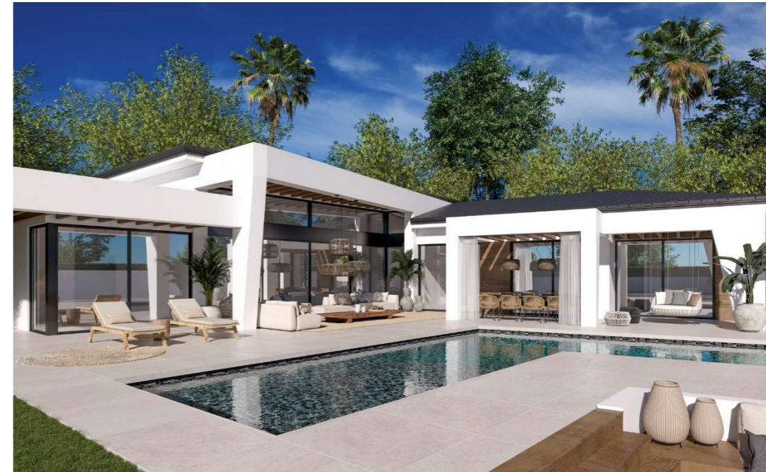
Imagen figurativa no vinculante. Propuesta de decoración opcional.

Se realizarán mediante sistema autoportante de yeso laminado, con aislamiento acústico de lana de roca en su interior, considerando placas de yeso laminadas hidrófugas en los paramentos de cuartos húmedos. Realizada según las directrices de la normativa CTE-DB-HE. Ahorro de energía; UNE 102040 IN, montaje de tabiquería de placas de yeso con estructura metálica.