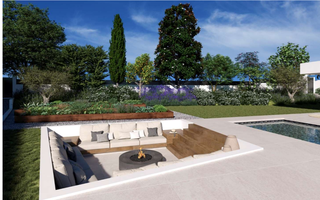
Imagen figurativa no vinculante. Propuesta de decoración opcional.

Las zonas exteriores de cada Villa - Marein Natura han sido cuidadosamente estudiados pensando en la combinación de su especial diseño arquitectónico al estar cada vivienda proyectada en una sola planta, contando con su propio paisajismo y huerto ecológico para que se disfrute de la frescura de la naturaleza, pueda cocinar con sus propios ingredientes y alimentos, percibiendo las especies aromáticas que caracterizaran su vivienda, a la vez que disfrute del máximo aprovechamiento al disponer de unas amplias terrazas, zonas ajardinadas, piscina y zona chill out con fuego de invierno.