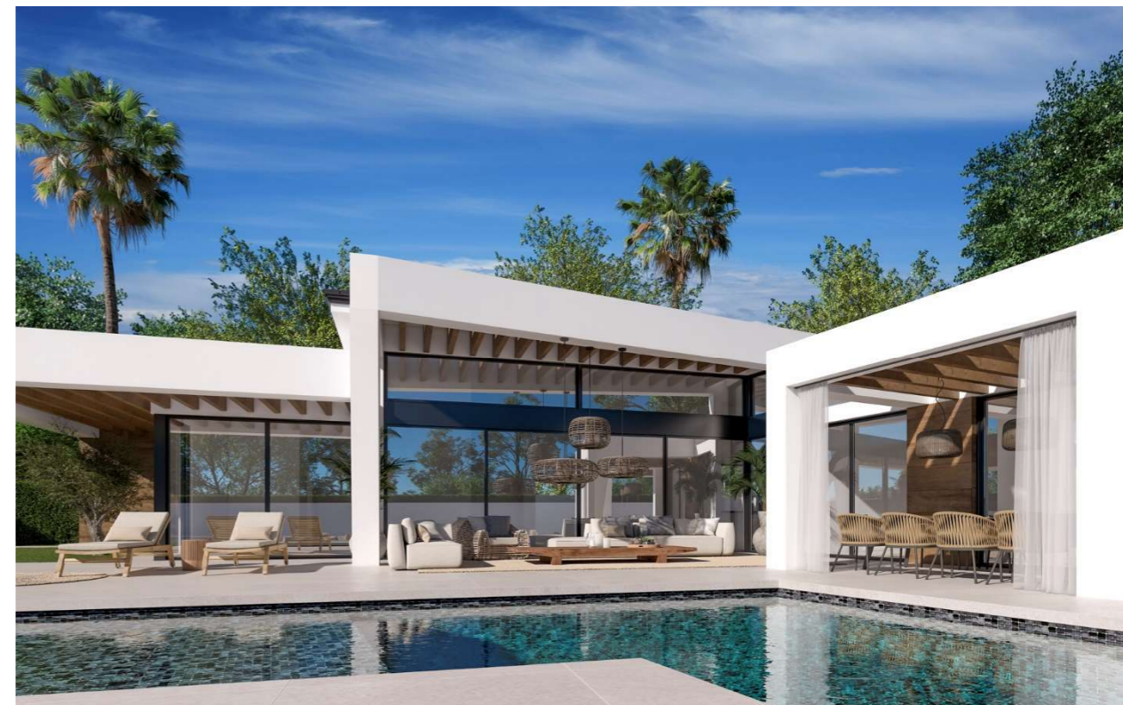
Imagen figurativa no vinculante. Propuesta de decoración opcional.

En dormitorio master vestidor con iluminación led y distribución, y armarios empotrados con puertas suelo techo en el resto dormitorios, vestidos interiormente con distribución funcional de baldas separadoras, barras de colgar y cómoda con cajones.