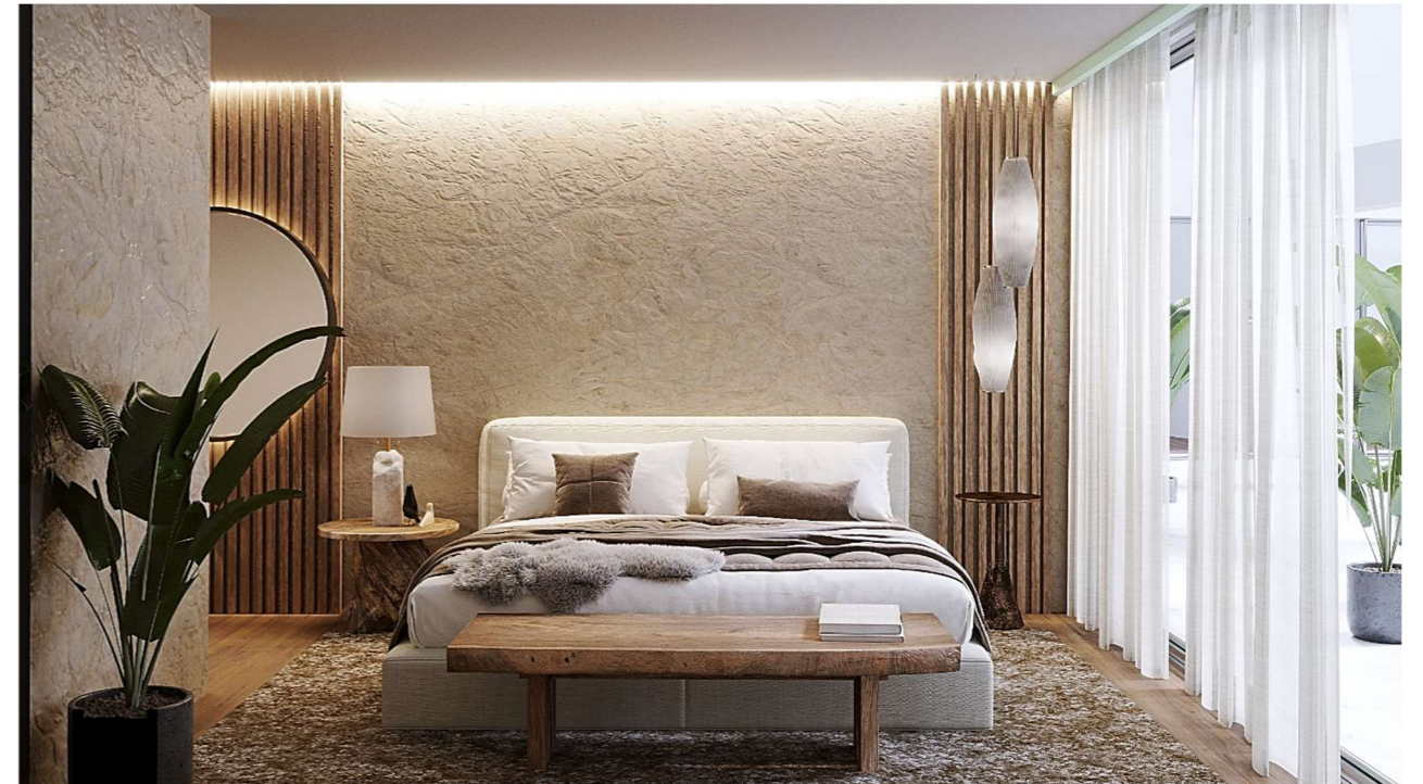
Imagen figurativa no vinculante. Propuesta de decoración opcional.