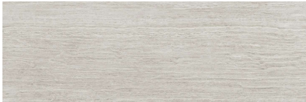
Travertino Grey 100x300 cm

En baño principal se diseña una caja para el área ducha y bañera alicatada completamente y de gran efecto visual, con porcelánico rectificado de gran formato con terminación efecto travertino.