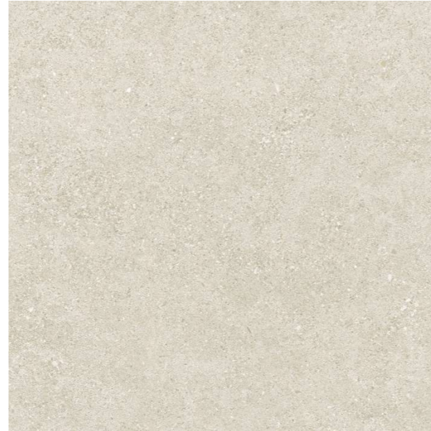
Roadstone Linen 90x90 cm

Solado interior y exterior en gres porcelánico Roadstone Linen 90x90 cm rectificado con terminación efecto piedra natural según imagen adjunta, con terminación C3 en zona de baños y zonas exteriores.